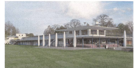
Strandbad und Stadion Lachen, Thun.

Im Schatten der Alpen finden sich städtische und ländliche Oasen sondergleichen. So bietet der Samstag architektonische Entdeckungen, der Sonntag führt mit Spaziergängen und Wanderungen ins Grüne. Am Thunersee ist der Schadaupark mit seinem herrschaftlichen Schloss für Einheimische und Touristen gleichermaßen ein beliebter Rückzugsort. Auf einer Führung wird Ihnen die Architektur von Schloss und Park durch Experten näher gebracht.