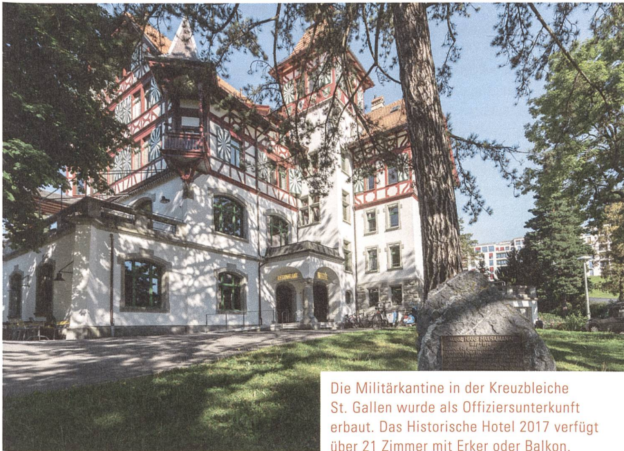
Die Militärkantine in der Kreuzbleiche St. Gallen wurde als Offiziersunterkunft erbaut. Das Historische Hotel 2017 verfügt über 21 Zimmer mit Erker oder Balkon.