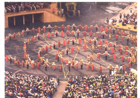
Herbsttanz am Vinzerfest in Vevey im Jahr 1972.

Als erste von acht lebendigen Traditionen der Schweiz wurde im vergangenen Dezember das Winzerfest Vevey in die repräsentative Unesco-Liste des immateriellen Kulturerbes der Menschheit aufgenommen. Das 2015 eingereichte Bewerbungsdossier wurde insbesondere als Musterbeispiel gerühmt, wie eine lebendige Tradition mit dem Unesco-Weltkulturerbe, der Landschaft des Weingebietes Lavaux nämlich, verbunden werden kann.