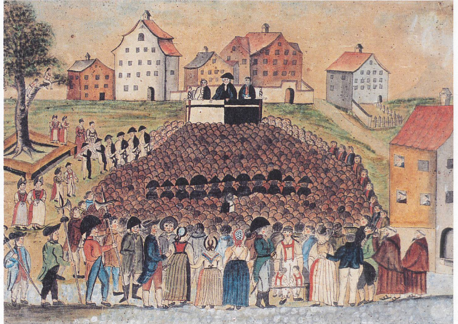
Die Landsgemeinde von Appenzell, 18. Jh., Aquarell.

auf dem Landsgemeindeplatz. Die Glocke mahnt zur Ruhe und Besinnung und unterstreicht den gottesdienstähnlichen Charakter der Landsgemeinde.