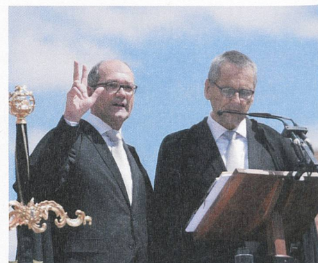
Die Eidesleistung des regierenden Landammanns.

Auf dem Landsgemeindeplatz folgt das Zusammenstehen – auch im übertragenen Sinn: Man wird als Einzelner ein Teil des Ganzen, fühlt sich der politischen Schicksalsgemeinschaft zugehörig; soziale Gegensätze sind, zumindest für die Dauer der Landsgemeinde, nicht relevant. Man steht aber nicht nur zusammen – Volk und Regierung stehen sich Auge in Auge gegenüber; man legt Rechenschaft ab und verspricht, sich gegenseitig zu unterstützen und für das Land einzustehen. Der abstrakte Staat, die anonyme Bürokratie werden konkret erlebbar. Das «Wir sind das Volk», das wir alle noch in den Ohren haben, wird an der Landsgemeinde zur alljährlichen Selbstver-