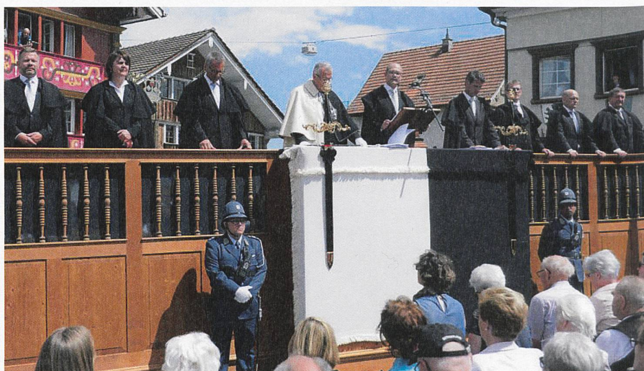
Der regierende Landammann übernimmt nach seiner Wahl das Landessigill und verspricht dem Landsgemeindevolk, dieses nach Verfassung und Gesetz zu gebrauchen.

So richtig los aber geht das gesellschaftliche Ereignis Landsgemeinde für viele erst nach der Versammlung – und das grosse Feiern und Festen auf den Gassen und in den Gasthäusern von Appenzell endet oft erst in den frühen Morgenstunden. Es sind buchstäblich «alle» da und zu diesen gesellen sich sehr viele Heimweh-Innerrhoderinnen und -Innerrhoder.