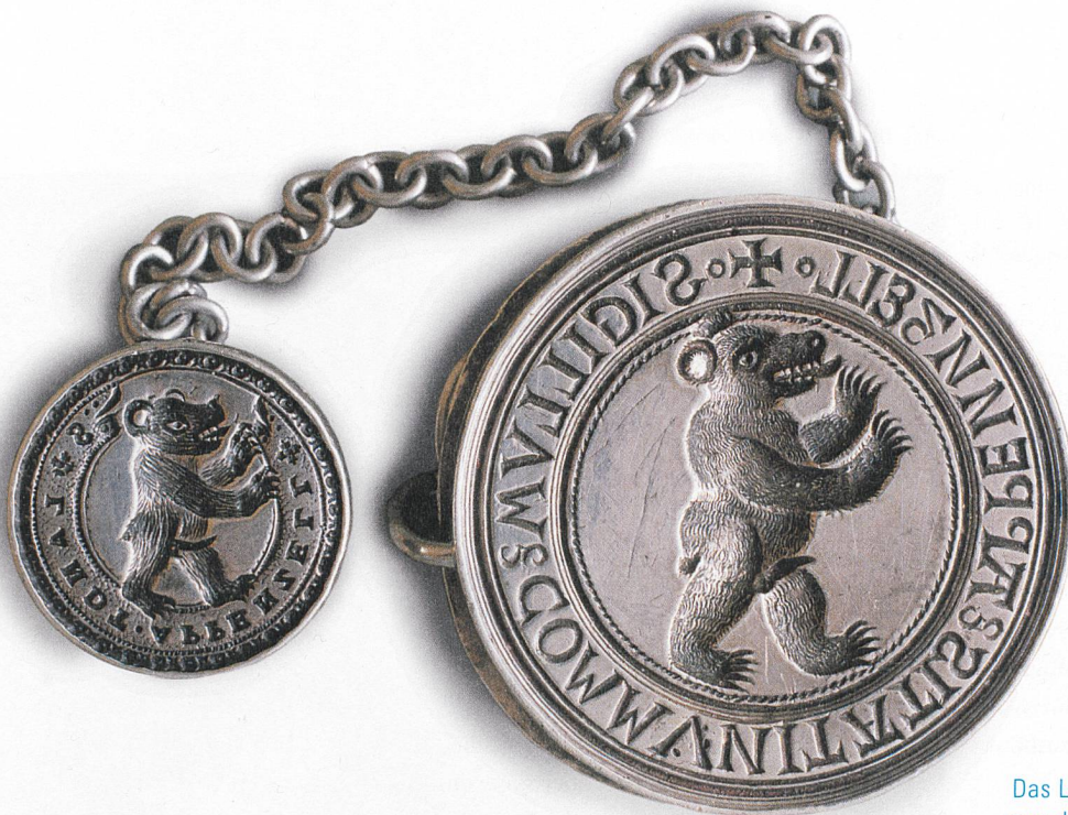
Das Landessigill aus dem Jahr 1518.