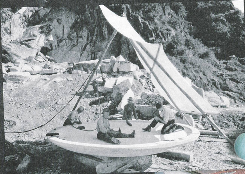
Lavorazione di una fontana del diametro di 4 metri nelle cave di Castione. Anni '40 del XX secolo.