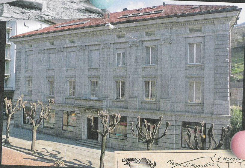
Palazzo Ginevrina (oggi Banca Popolare di Sondrio), Viale Stazione 26, Bellinzona: Edificio realizzato nel 1920–1923 dagli architetti Enea Tallone e Silvio Soldati. Presenta una facciata neoclassica interamente in gneiss della Riviera: un esempio di utilizzo del materiale locale agli inizi del XX secolo.