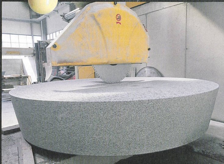
Lavorazione con una fresa a controllo numerico di una fontana circolare presso le cave di Cresciano, 2018: Fontana per il comune di Oberägeri, scultore Karl Imfeld.