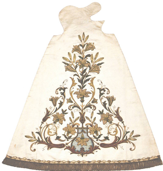
Abb. 3: Schwyzer-Kleid, weisse Seide, Chenille-Relief, Plüschapplikationen, 1922 vom Frauenkloster St. Josef Schwyz gestiftet.