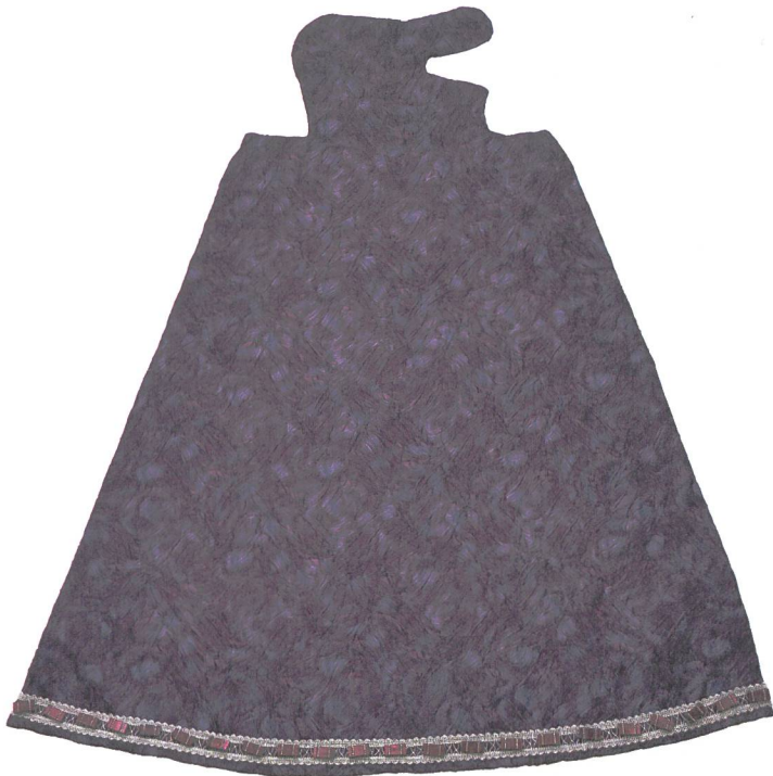
Abb. 5: Mantova-Kleid, Damaststoff mit Silverbordüren und Glaskristallen, Stifter Evelina Bassi, Gius- eppina Tonelli, Luigi Milani, gefertigt in Mailand 2010.