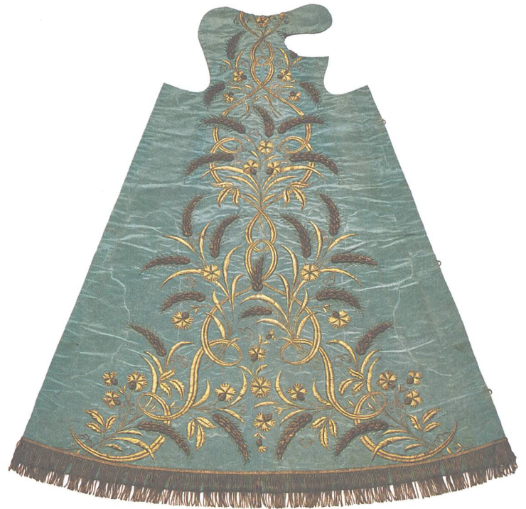
Abb. 6: Hohenzollern-Kleid, Hellblauer Satin-Da- mast mit Goldstickerei. Goldähren. Aus der ehemaligen Hofschlep- pe der Fürstin von Hohenzollern-Sigmarin- gen genäht und von ihr gestiftet, 1909.