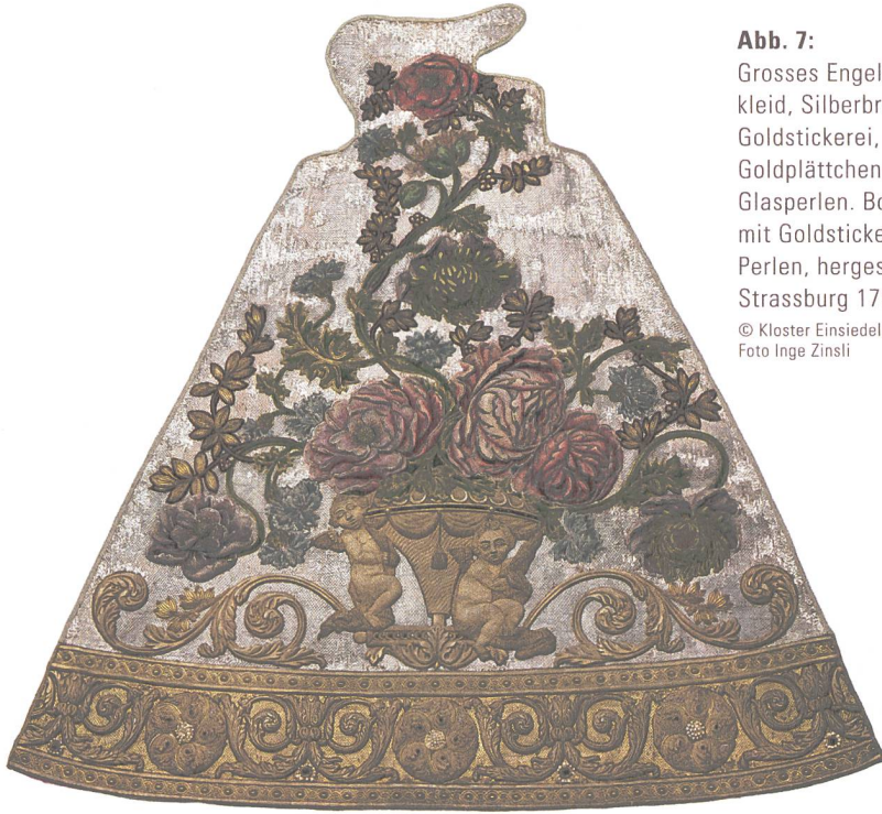
Abb. 7: Grosses Engelweih- kleid, Silberbrokat mit Goldstickerei, Perlen, Goldplättchen, rote Glasperlen. Bordüre mit Goldstickerei und Perlen, hergestellt in Strassburg 1792.