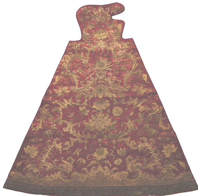
Abb. 4: Pfingstkleid, reiche Goldstickerei auf rotem Grund, gefertigt in Mailand 1750.