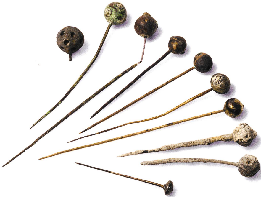
Abb. 2: Bronzezeitliche Funde aus dem Thunersee, durch einen Taucher entdeckt.