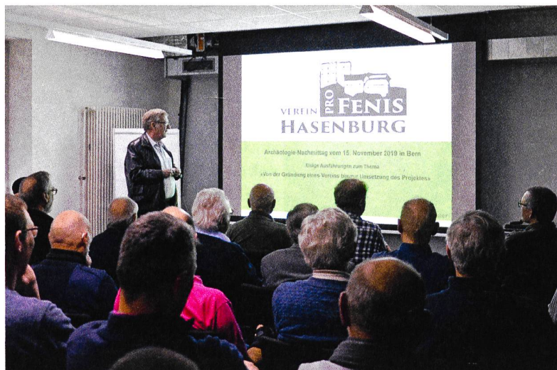
Abb. 9: Archäologie-nachmittag für ehrenamtliche Mitarbeitende 2019. Der Präsident des Vereins «Pro Fenis Hasenburg» stellt seinen Verein vor.