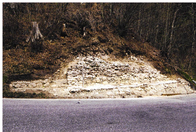
Abb. 5: Freigelegte Kapellenreste in Aeschi bei Spiez, die von einem Lokalhistoriker gemeldet wurden.