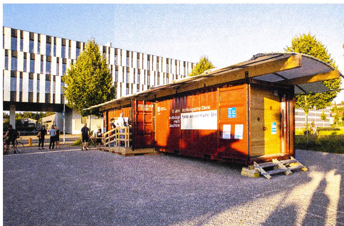
Abb. 4: Die Wanderausstellung zum 50-jährigen Jubiläum des ADB 2020 wurde mit Unterstützung von freiwilligen Helfern durchgeführt.