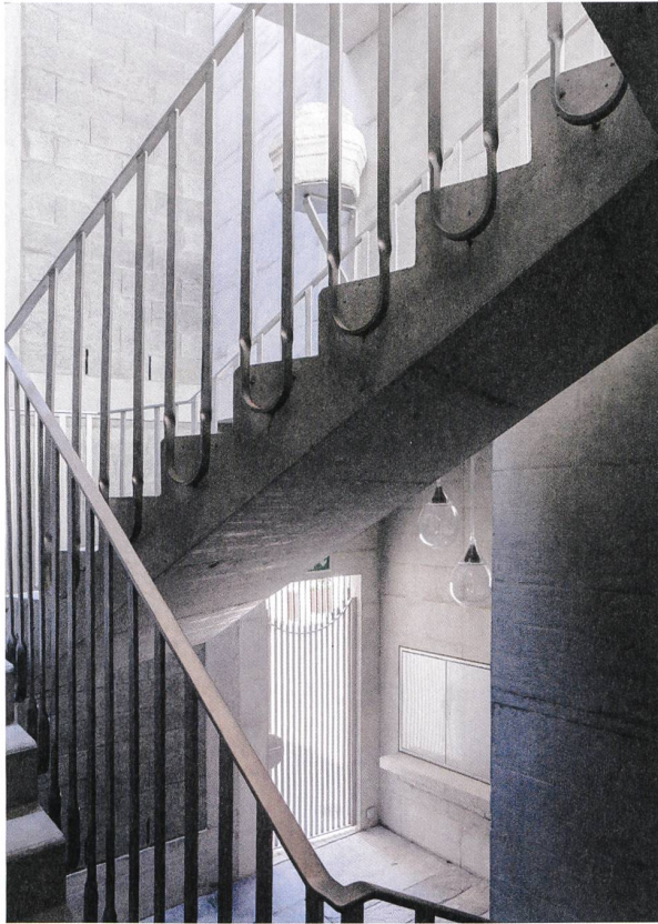
Offenes Treppenhaus mit spätantikem Säulenstumpf als Spolie aus dem Aushub.