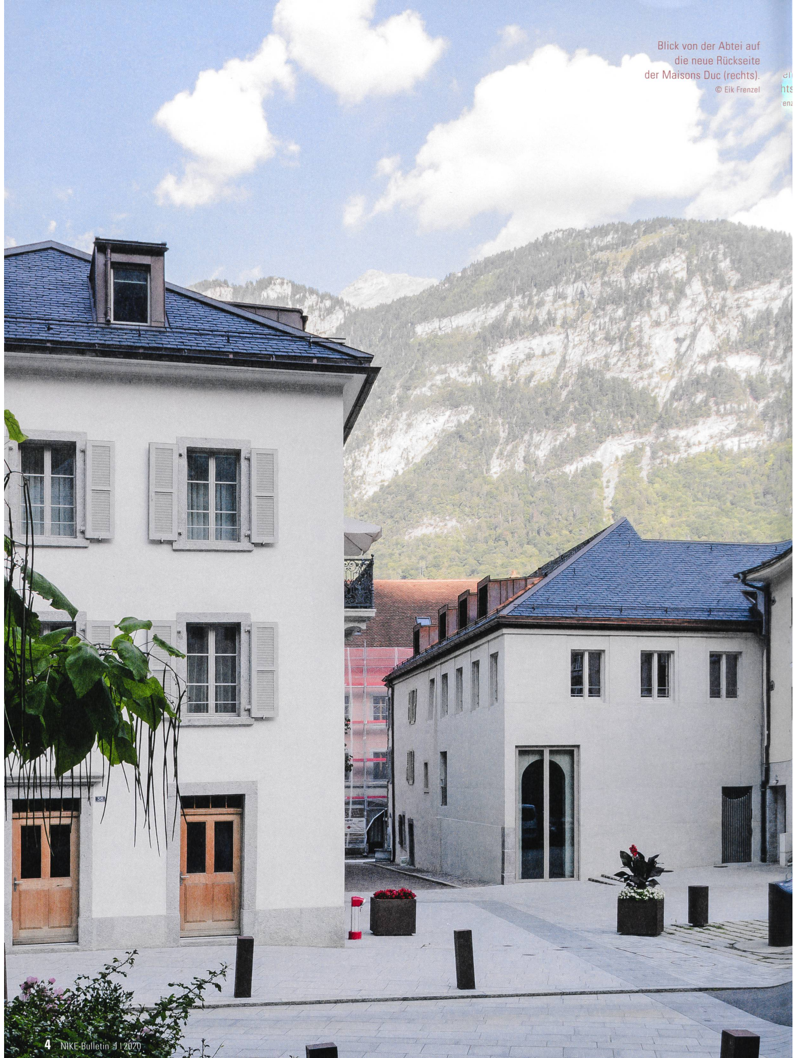
Blick von der Abtei auf die neue Rückseite der Maisons Duc (rechts).