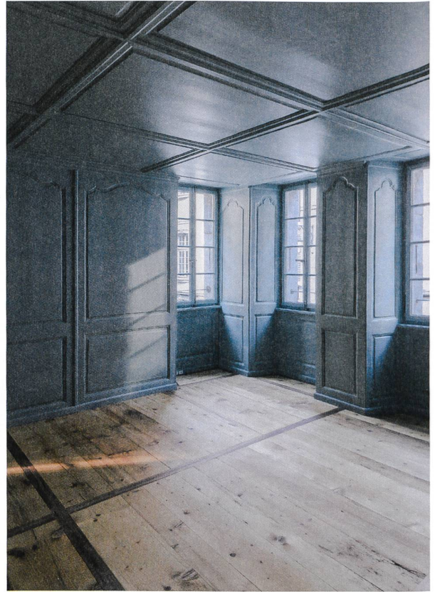
Historische Stube im ersten Obergeschoss.

Ein Relief gibt seinen rauen Betonwänden Tiefe – ursprünglich war gedacht, es für die Zwecke der Galerie mit Gipsplatten auszukleiden, doch der imposante Anblick des ausgeschalteten Raums liess das schlicht nicht mehr zu.