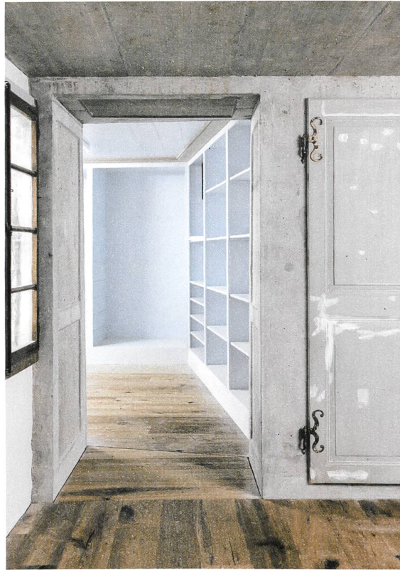
Blick ins Ateliergeschoss. Auf der neuen Betonwand ist eine alte Tür rahmenlos aufgesetzt.