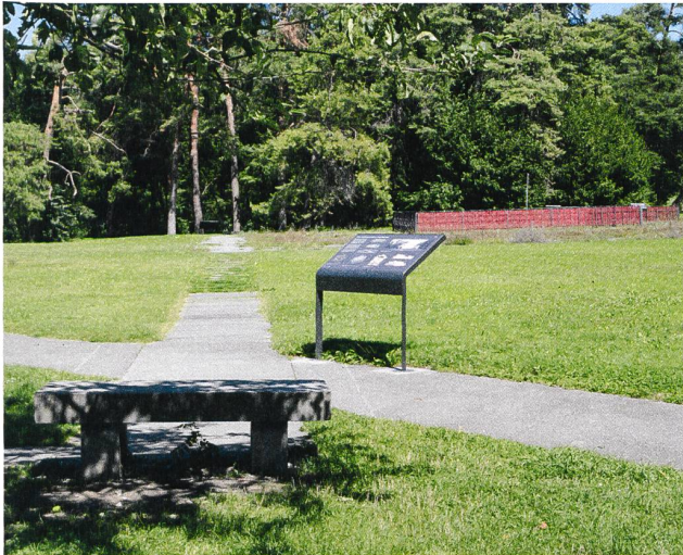
Fig. 7: Genève, Parc de la Grange. Mise en valeur des vestiges dans le cadre d'un concept d'architecture paysagère spécifique pour un agréable lieu de rencontre et de promenade.