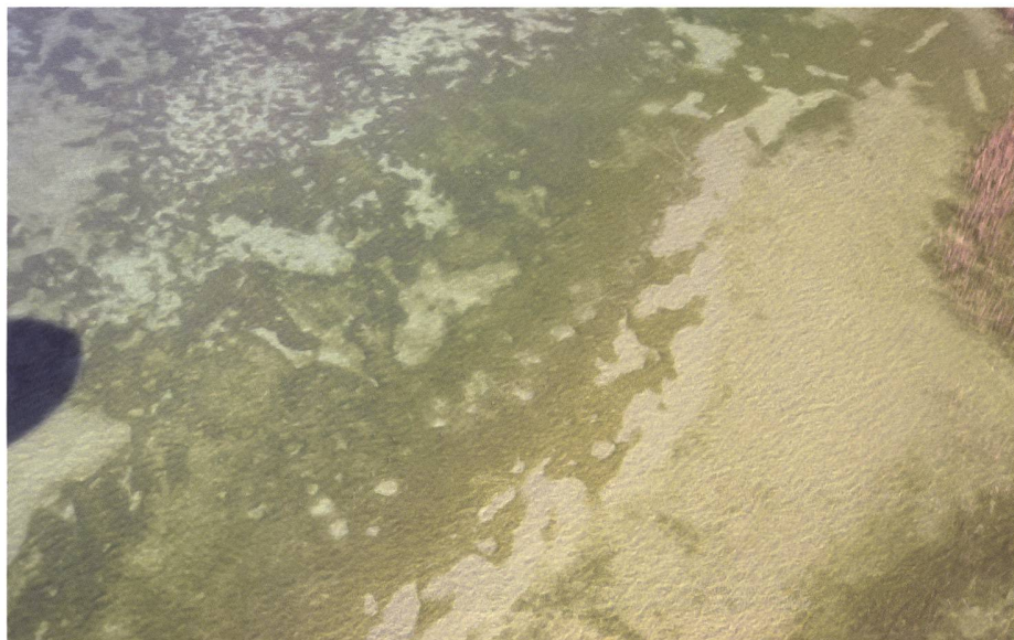
Fig. 2. Vue aérienne de la station lacustre de Font – Trabiétaz (FR), 2021.

Par Dr. Philippe Baeriswyl, collaborateur scientifique auprès du Centre NIKE et responsable des Monuments auprès des Site et Musée romains d'Avenches, philippe.baeriswyl@nike-kulturerbe.ch