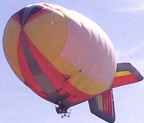
Fig. 1. Photographie du dirigeable de Fabien Droz, 2021.

L'utilisation de la photographie aérienne en archéologie entre passé, présent et évolution future