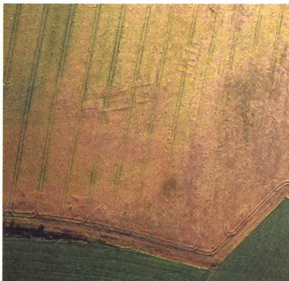
Fig. 3. Vue aérienne de la villa de Kleinbödingen « Zendholzacker » (FR), juillet 1998.