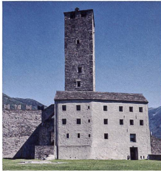
Das Castelgrande in Bellinzona.