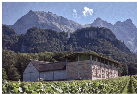
Künftiges Kulturerbe: Weingut Gantenbein in Fläsch.