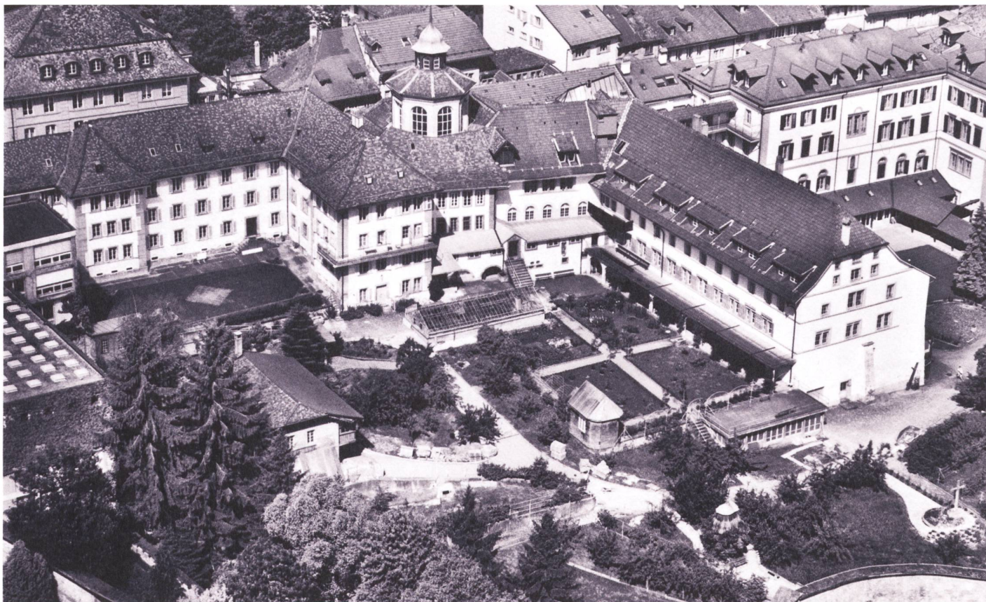
Le Monastère de la Visitation vu d'en haut.