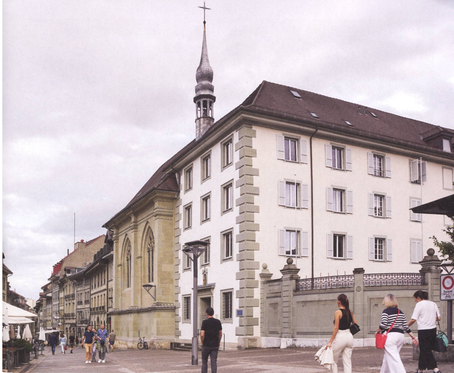
L'entrée de la vieille ville de Fribourg avec le couvent des Ursulines à droite.