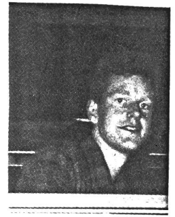
Fletch's Blick aus dem Bus - Fenster