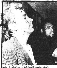
John Lydon and Africa Bambaataa

Eine Mischung von Buschmusik, John Lydon, krächz, stöhn, würg und einer dazu begleitenden verträumten Synthi-Melodie. Die Rückseite ist für "World Destruction -Fan ein besonderer Leckerbissen; beginnend mit einer Umweltkatastrophen-Stimmung, folgend Pongo-Einsatz und ein Super-Mix von... TIME ZONE