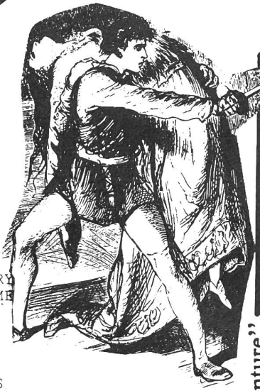
"Love's great adventure."

STANDING ON MY OWN IT DIDN'T MEAN THAT MUCH TO ME I THOUGHT I HAD IT ALL I DIDN'T SEE THE MYSTERY I STOOD THE TEST OF TIME AND I TOOK THE STEP TO FIND LOVE'S GREAT ADVENTURE'S MINE