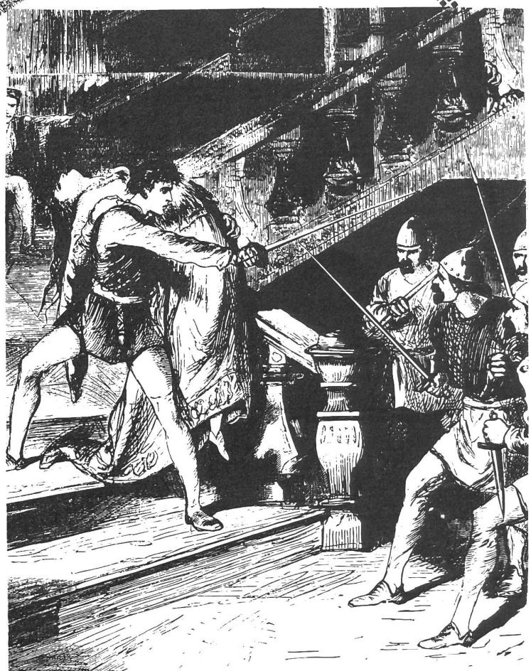
"Love's great adventure."