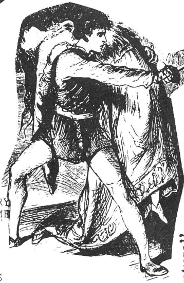
"Love's great adventure."

STANDING ON MY OWN IT DIDN'T MEAN THAT MUCH TO ME I THOUGHT I HAD IT ALL I DIDN'T SEE THE MYSTERY I STOOD THE TEST OF TIME AND I TOOK THE STEP TO FIND LOVE'S GREAT ADVENTURE'S MINE