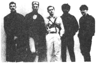
FRANKIE GOES TO HOLLYWOOD FRANKIE GOES TO IRELAND WELCOME TO THE NEW LP !

Fränki gous tu holiwud für's Kinderzimmer: Das grosse Geldverdienen mit COMPUTER - SPIELEN