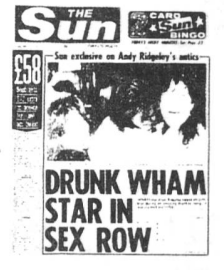
WHAM! in den Klatsch-Schlagzeilen Englands