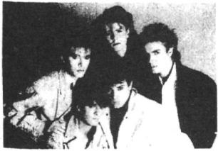
DURAN DURAN = POWER STATION = ARCADIA