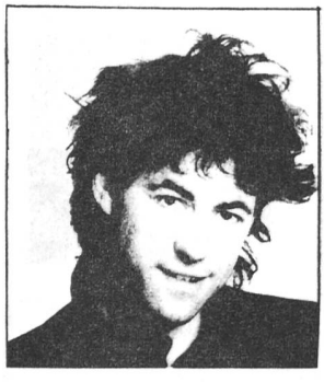
Als Dr.Dr.Prof.iur.etc. hätte es Bob Geldof wahrscheinlich geschafft