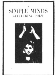
BIO mal zwei!