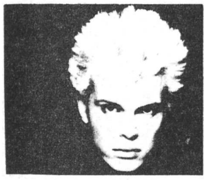
Billy Idols Einfallosigkeit ist echt ätzend... Trotzdem: WHY CLASH SMILE ist die neue LP und kommt im November