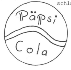
KOHLN durch COLA !

Seit langem bemüht, COCA COLA zu übertreffen - mindestens in Sachen Skrupellosigkeit hat PEPSI das berühmtere COLA geschlagen