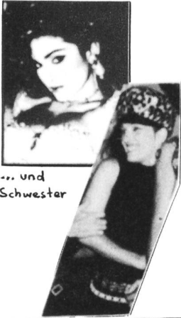
... und Schwester

Bringen wirs gleich hinter uns!!! - MADONNA ist natürlich gemeint!!! - Entweder badet die Dame in einem ätzenden Parfume oder sie kennt das einfachste Waschmittel - die hunds-kommune Seife - nicht, wenn sich gleich zwei Herren so ganz und gar nicht auf die "feine englische Art" über sie äussern: "I hate her. - She looks like she stinks!" - Originalton ROBERT SMITH (CURE). Oder JOHN TAYLOR (Schönling und Wüstling jener Pseudo-Band DIURAEN DIURAEN). - Sein Kommentar dazu: "Ich finde, MADONNA sieht so aus, als ob sie etwas streng riechen würde." Na ja, der gute SEAN PENN muss einen sehr miesen Geruchssinn haben... Um beim Thema zu bleiben; vielleicht gibts bald noch eine MADONNA Number 2 (???) - Grund; Frau Penn hat eine Schwester. Diese gleicht ihr zwar aufs Haar, will jedoch nicht so sehr im Rampenlicht stehen wie her sister. Doch was noch nicht ist, kann ja bekanntlich noch werden. (Gott möge uns diese Strafe ersparen!!!)