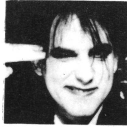
KEIN MADONNA - FAN!!!