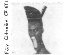
Für Gioen CX GTI