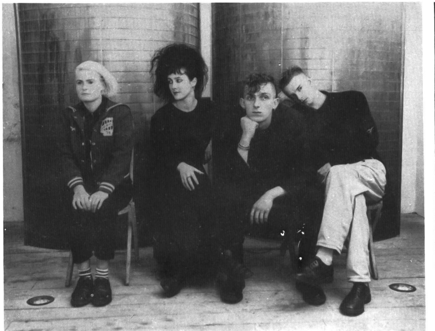
THE FRAZIER CHORUS

Wenn es FRAZIER CHORUS (Verdammt, der Name hört sich so peinlich nach der Jodel-Fräse an) schaffen auf ihrer LP, die bald kommen soll und SUE heissen wird, 10 weitere solcher Pop-Perlen zu machen, gehören sie wirklich zu den Hoffnungen im öden Pop-Leben. Tim meint, die LP sei ein "Reisser". Eine der guten Maxis 1987 ist ihnen mit ihrem "schmalzigem Herzen" schon gelungen - Freu dich Fräse!!! Bernd