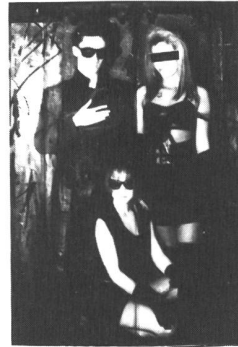
DIE FORM: Kunst oder Pornographie? Eine Ausnahmeerscheinung auf Tour

Als Ersatz gibt's ausserdem jede Menge interessante zusätzliche Infos und Interviews, die in No. 40 nicht angekündigt waren. Allem voran ein hoffentlich erschöpfender Bericht über Frankreichs absolute Kult-Band Nummer eins: DIE FORM , die zur Zeit auf Deutschland-/Schweiz-Tournee sind. (Konzert in Zürich, StuZ: 11.3.89). Ein recht ausgefallenes Projekt übrigens, dass live zu einem wirklich einmaligen Erlebnis werden wird. Live-Performance at it's best!