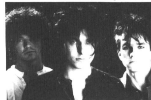
Pink Turns Blue - kürzlich on Tour mit LAIBACH

Vom gleichen, immer aktiveren und erfolgreicher werdenden Label "Fun Factory", werden PINK TURNS BLUE vertrieben. Unser Mitarbeiter Manfred Zippel unterhielt sich mit der neuen Hoffnung am deutschen Independent