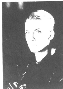
Annie Lennox / Eurythmics