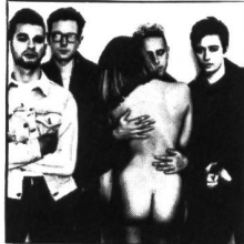
Depeche Mode's Skandalchen

tun dies, clever clever, mittels eines ach so skandalösen, neuen Pressefotos. Clou des Bildes: Martin L. Gore wird von einer nackten Schönen vor den Augen seiner zerknirschten Bandkollegen umgarnt. Ob das den Gerüchten abhelfen wird, die da besagen, Martin sei bi-sexuell...?