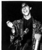
STARTER on CD...