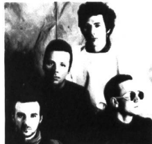
Ultravox versuchens wieder