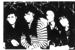
Gemeinsame US-Tour Pankow/ã;Grumh...

Die NL-Lesern bestens bekannte Oldenburger Band GYPZNIK werden immer noch mit "Not only for the weaker" in der Playlist von Radio Marabu zwischen