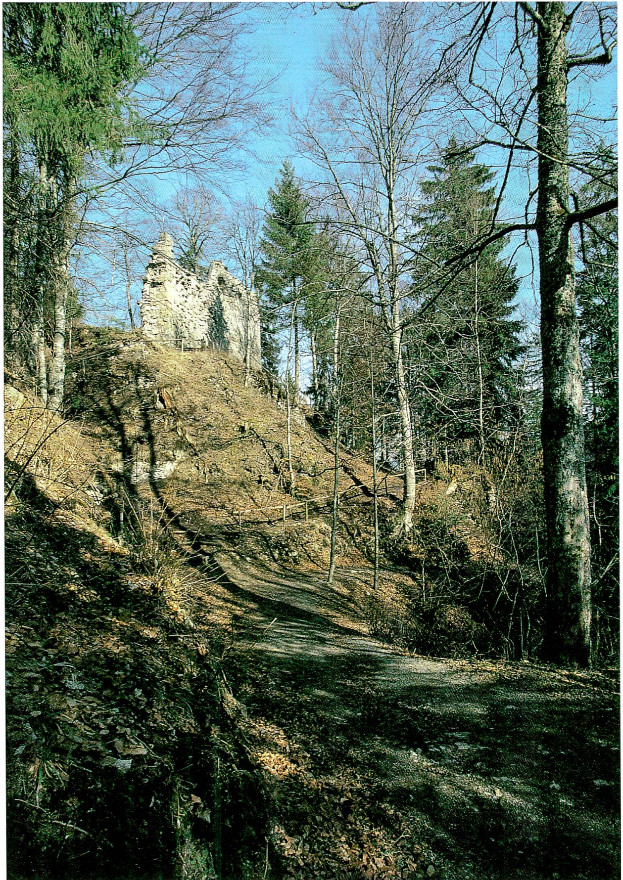
Abb. 8: Die Ruine Neu-Tannegg – auch Burg Boll genannt – liegt am Weg von Dorf Boll zum ehemaligen Bad Boll.