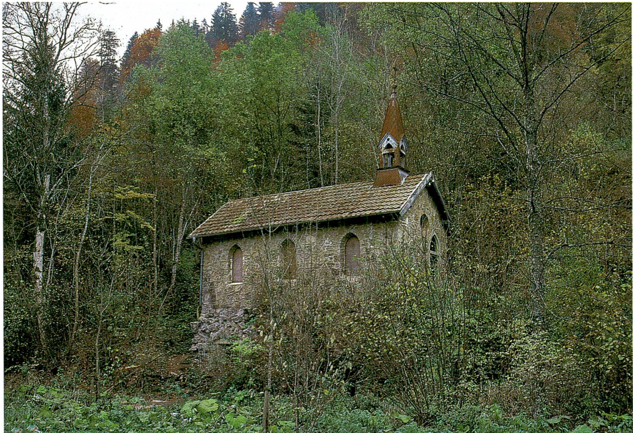
Abb. 12: Nur das zerfallende Kirchlein erinnert noch an die Badesiedlung.