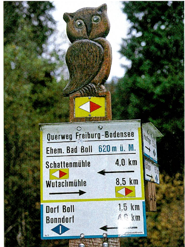
Abb. 9 und 10: Alte und neue Orientierungszeichen säumen die Wanderwege.

als Heimat des «Bick von Allmendshofen» bezeichnet; auch die Burgmühle selbst ist erwähnt.