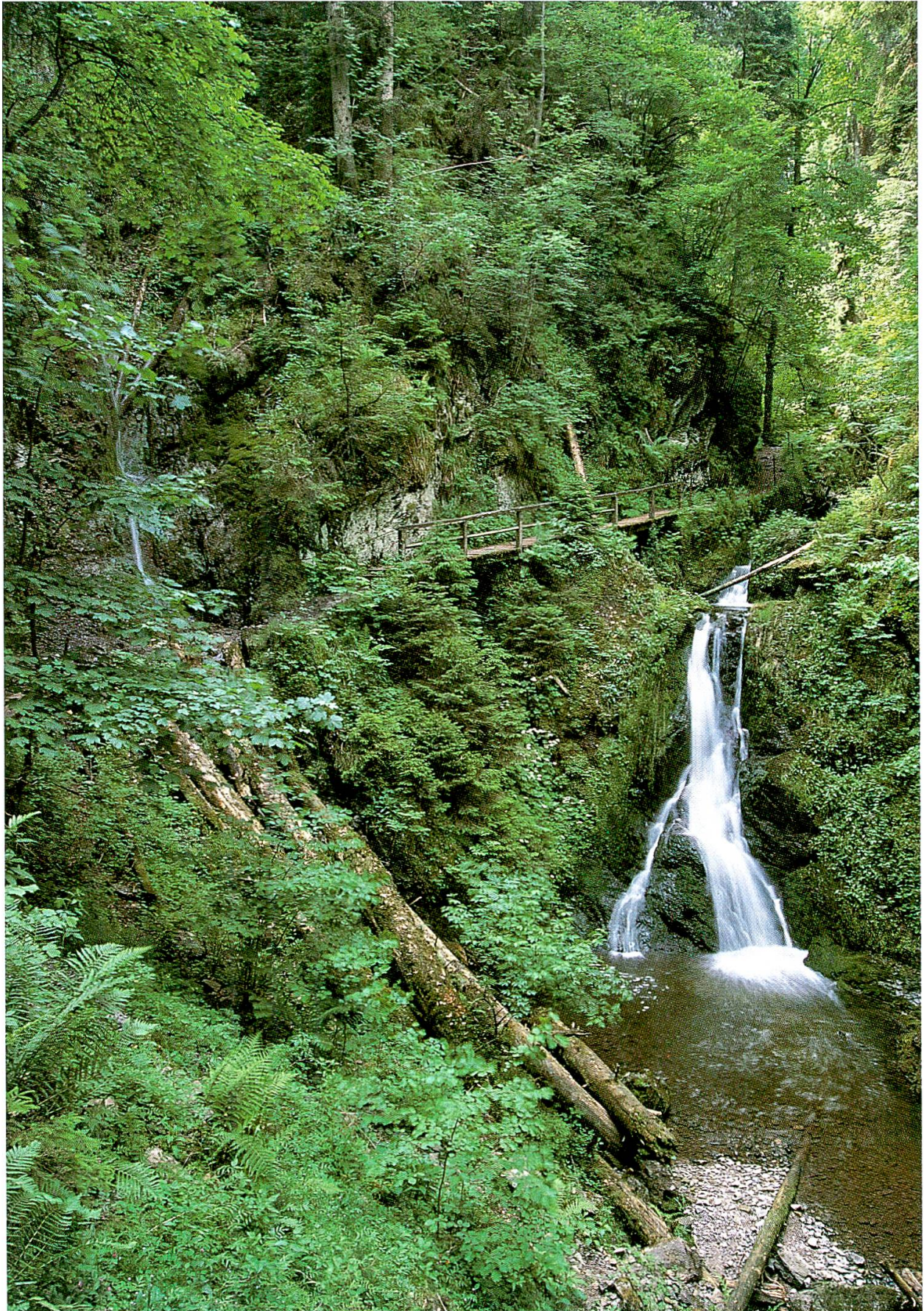
Abb. 4: Die Lotenbachklamm. Bei der Schattenmühle stürzt der Lotenbach über den Fels und fließt in die Wutach.