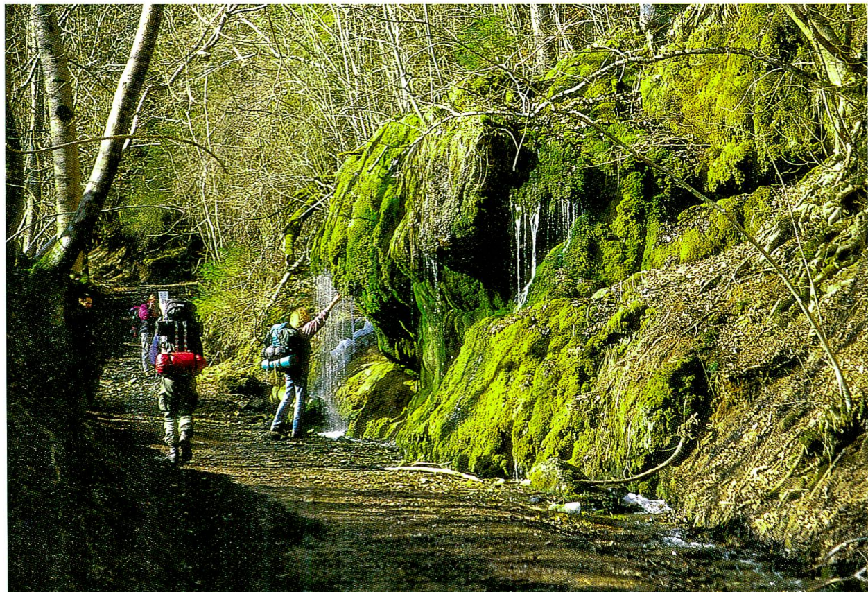
Abb. 14: 80 000 bis 100 000 Wanderer besuchen jährlich die beiden Schluchten.