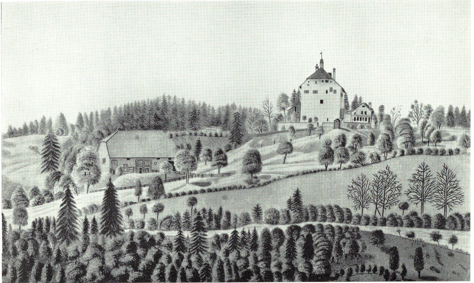
Schloß Oberberg zu Beginn des 19. Jahrhunderts. Farbige Handzeichnung aus jener Zeit.