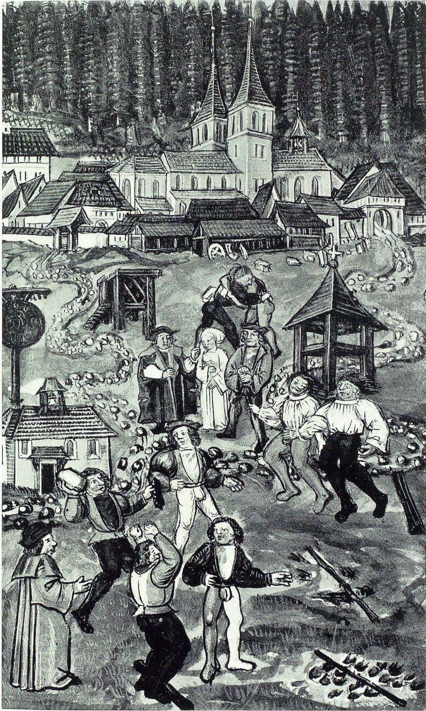
Volksfest anfangs 16. Jahrhundert. Aus der Luzerner Bilderchronik des Diebold Schilling. Original in der Zentralbibliothek Luzern.