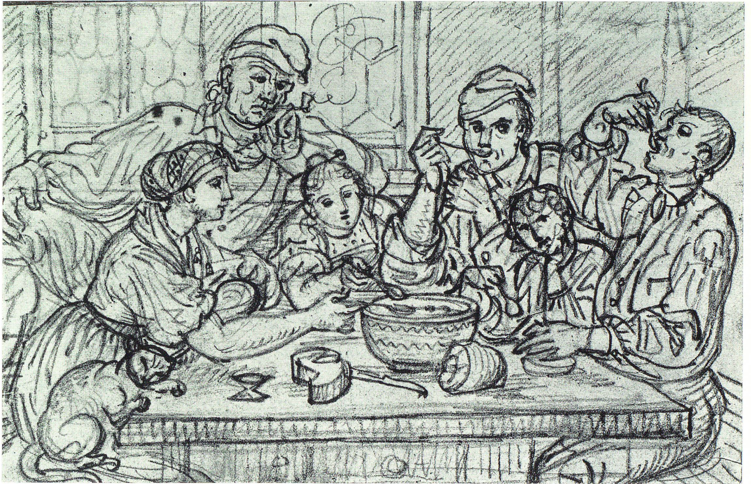
Bauernfamilie beim Mittagmahl. Bleistiftzeichnung v. Ludwig Vogel in Zürich, 1788–1879, Schweizerisches Landesmuseum in Zürich.