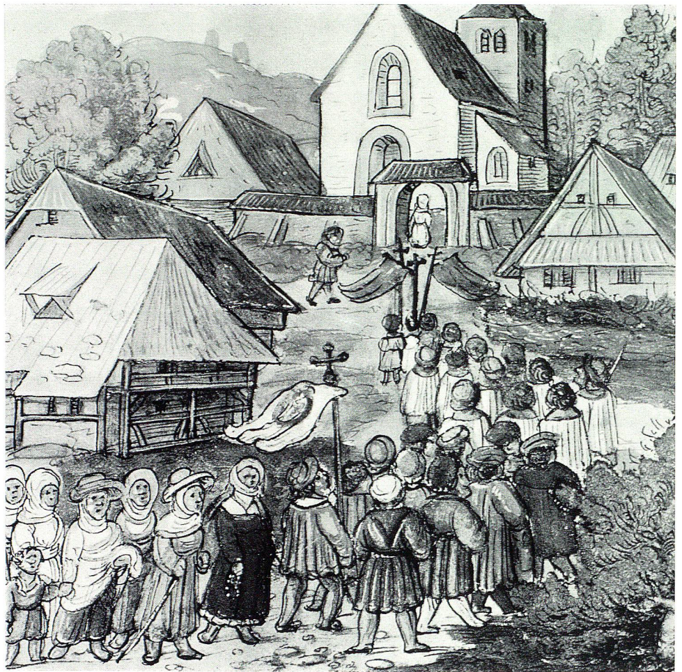
Prozession in einem Dorf, anfangs 16. Jahrhundert. Aus der Luzerner Bilderchronik des Diebold Schilling. Original in der Zentralbibliothek Luzern.

Ich beginne vorerst mit den kirchlichen Gebräuchen in der Alten Landschaft. Da möchte ich einmal eine Fronleichnamspzession , wie sie uns aus dem Jahre 1739 überliefert wurde, einläßlich schildern. Wie alle übrigen Monatsprozessionen fand sie nicht am Vormittag, sondern am Nachmittag statt. Nach der Schuljugend schritten paarweise die Jungfrauen daher, alle im schönsten Staate gekleidet und ohne Ausnahme mit dem sogenannten Schäppeli auf dem Kopfe. Das war eine Art Kranz, der aus vier künstlichen Rosen aus Federn bestand. Wer das Schäppeli nicht trug — und das galt als öffentliche Schande! — wurde an den Schluß der Prozession