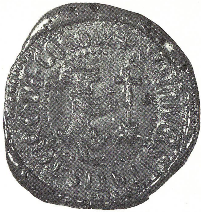
Siegel von Gossau vom Jahre 1401.