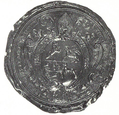
Siegel des Siechenhauses bei St. Gallen anno 1562.