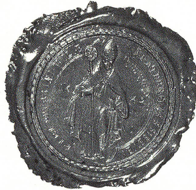
Siegel: Finsternis SS. Severini, Wil, 1642.