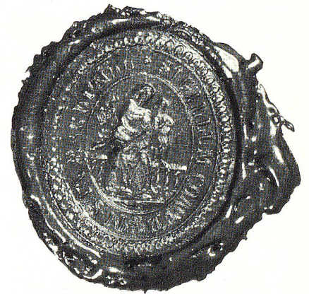
Siegel des Frauenklosters Magdenau, undatiert.