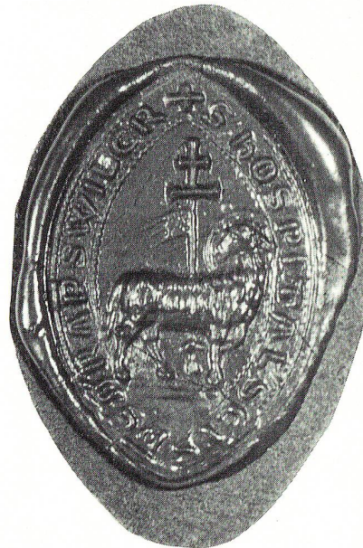
Siegel des Spitals in Rapperswil, undatiert.