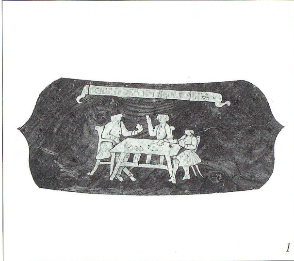
Abb. 4: «ES LEBE DER HER OBERVOGT».

Abb. 3: «DIE WEIBER STIFTEN VIL VNHEIL».