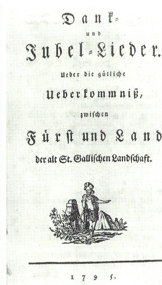
Insgesamt sind sechs Dank- und Jubellieder überliefert. Alle feiern enthusiastisch den Abschluss des Gütlichen Vertrages.