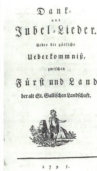
Insgesamt sind sechs Dank- und Jubellieder überliefert. Alle feiern enthusiastisch den Abschluss des Gütlichen Vertrages.