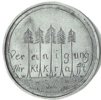
Gedenkmünze an die «Landsgemeinde» vom 24. Februar 1795 in Gossau. Historisches Museum St. Gallen.

ges Beteiligten, allen voran Fürstabt Beda. Ein ovales Brustbild des Landesherrn ziert gar ein Flugblatt mit einem sechsstrophigen Jubelgedicht. 22 Das Gedicht bejubelt in höchsten Tönen Fürstabt Beda, den Abschluss des Gütlichen Vertrages, die enge Verbundenheit zwischen Landesherrn und Volk, Dekan, die Patres Magnus Hungerbühler und Blasius Müller und hofft auf Einsicht und Einlenken des Konvents. Auf einem zweiten erhalten gebliebenen Flugblatt (Abb. S. 85) ist oben Fürstabt Beda mit einem von zwei Putti gehaltenen Ehrenkränzlein abgebildet. Unten befinden sich die Porträts der drei Gossauer Revolutionäre. 23 Das achtstrophige Jubellied Den Stein der Weisen ist sogar mit einer Melodie überliefert. 24 Auch es dankt und lobt Fürstabt Beda, Dekan Cölestin Schiess, die Patres Magnus Hungerbühler und Blasius Müller, die politischen Führer Künzle, Anton Heer von Rorschach, Josef Anton Müller von St. Georgen, die übrigen Ausschussmitglieder und die ziemlich offen mit den st.gallischen Aufständischen sympathisierenden Glarner und Schwyzer: