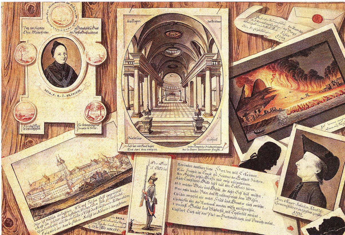
Quodlibet auf den Gütlichen Vertrag vom 23. November 1795. Von Johannes Hädener. Aquarell mit Tintenschrift, 1795. Kantonsbibliothek St. Gallen.

abt Beda über die Gossauer Anführer. Rechts unten ist die Jahreszahl 1795 angefügt. Auf dem Tisch des Ehrenaltars finden sich ein Tintenfass mit Schreibfeder, eine Urkunde mit der Aufschrift Competirliche Richter , ein geschlossenes, schmales Buch mit der Etikette Manuscript und ein aufgeschlagener Band mit der Titelüberschrift Die Menschenrechte . Es sind alles Anspielungen auf das Gedanken- gut der Französischen Revolution und den Gütlichen Vertrag.