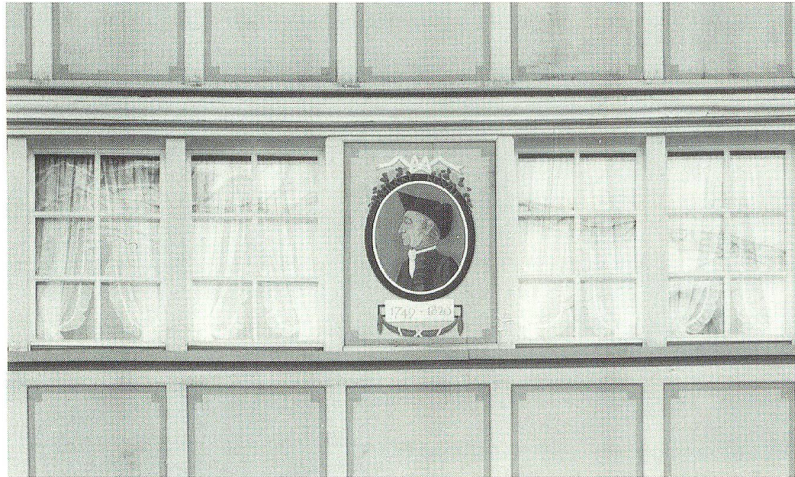
Porträt Künzles am Bot-Künzle-Haus an der Herisauerstrasse in Gossau. Das Haus war zeitweise Wohnsitz Künzles.

Das Teilbild rechts oben, das einen Brief mit dem Siegel K halb überdeckt, stellt den Ausbruch des Vesuvs von