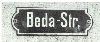
Drei Strassennamen erinnern seit 1903 in Gossau an die Landsgemeinde und die zwei Hauptprotagonisten.

ke Gestalt, die eine Art schwarzes, flaches Barett, eine rotbraune Jacke, ein weisses, kragenloses Hemd, grünblaue lange Hosen und schwarze Schuhe trägt, dürfte Wilhelm Tell darstellen. Allerdings fehlt mit der Armbrust das übliche Attribut. Es sind aber andere ähnliche Bilder Wilhelm Tells bekannt, und zudem erlebte der Schweizer Nationalheld im Umfeld der Französischen Revolution facettenreiche Um- oder Neuinterpretationen. 39 Tell wurde als Tyrannenmörder und Vorkämpfer der Freiheit verehrt. Den rechten Arm angewinkelt auf die Hüfte gestützt, zeigt er mit dem linken Zeigefinger stolz und zufrieden auf Künzle und seine zwei Mitkämpfer. Sein Gesicht blickt Niklaus von Flüe an, der eine braune lange Kutte trägt, die Hände gefaltet hält und barfuss ist. Auch er betrachtet wohlwollend die drei Gossauer. Die Figur des Einsiedlers vom Ranft galt als personifizierte Befreiungs- und Bundesidee. Zusammen mit Tell wurde sie zum wichtigsten Repräsentanten helvetischer Heldenmythologie.