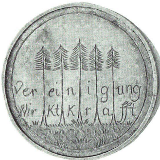
Gedenkmünze an die «Landsgemeinde» vom 24. Februar 1795 in Gossau. Historisches Museum St. Gallen.

ges Beteiligten, allen voran Fürstabt Beda. Ein ovales Brustbild des Landesherrn ziert gar ein Flugblatt mit einem sechsstrophigen Jubelgedicht. 22 Das Gedicht bejubelt in höchsten Tönen Fürstabt Beda, den Abschluss des Gütlichen Vertrages, die enge Verbundenheit zwischen Landesherrn und Volk, Dekan, die Patres Magnus Hungerbühler und Blasius Müller und hofft auf Einsicht und Einlenken des Konvents. Auf einem zweiten erhalten gebliebenen Flugblatt (Abb. S. 85) ist oben Fürstabt Beda mit einem von zwei Putti gehaltenen Ehrenkränzlein abgebildet. Unten befinden sich die Porträts der drei Gossauer Revolutionäre. 23 Das achtstrophige Jubellied Den Stein der Weisen ist sogar mit einer Melodie überliefert. 24 Auch es dankt und lobt Fürstabt Beda, Dekan Cölestin Schiess, die Patres Magnus Hungerbühler und Blasius Müller, die politischen Führer Künzle, Anton Heer von Rorschach, Josef Anton Müller von St. Georgen, die übrigen Ausschussmitglieder und die ziemlich offen mit den st.gallischen Aufständischen sympathisierenden Glarner und Schwyzer: