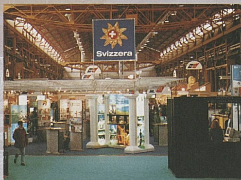
Nouvelle présentation dans les Foires internationales les plus importantes

Le «Profi-Tour» s'adressait à des organisateurs de voyages et se déroulait dans les villes de Berlin, Dresde, Leipzig, Prague et Budapest. A Bâle, Suisse Tourisme a organisé le 8ème Swiss Travel Mart, la manifestation Incoming la plus importante de Suisse. 400 présentateurs suisses ont reçu 300 agents de voyages de 39 pays et 70 représentants des médias suisses et étrangers.