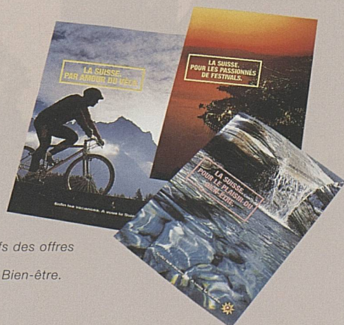
Paquets attractifs des offres Vélo, Festival et Bien-être.