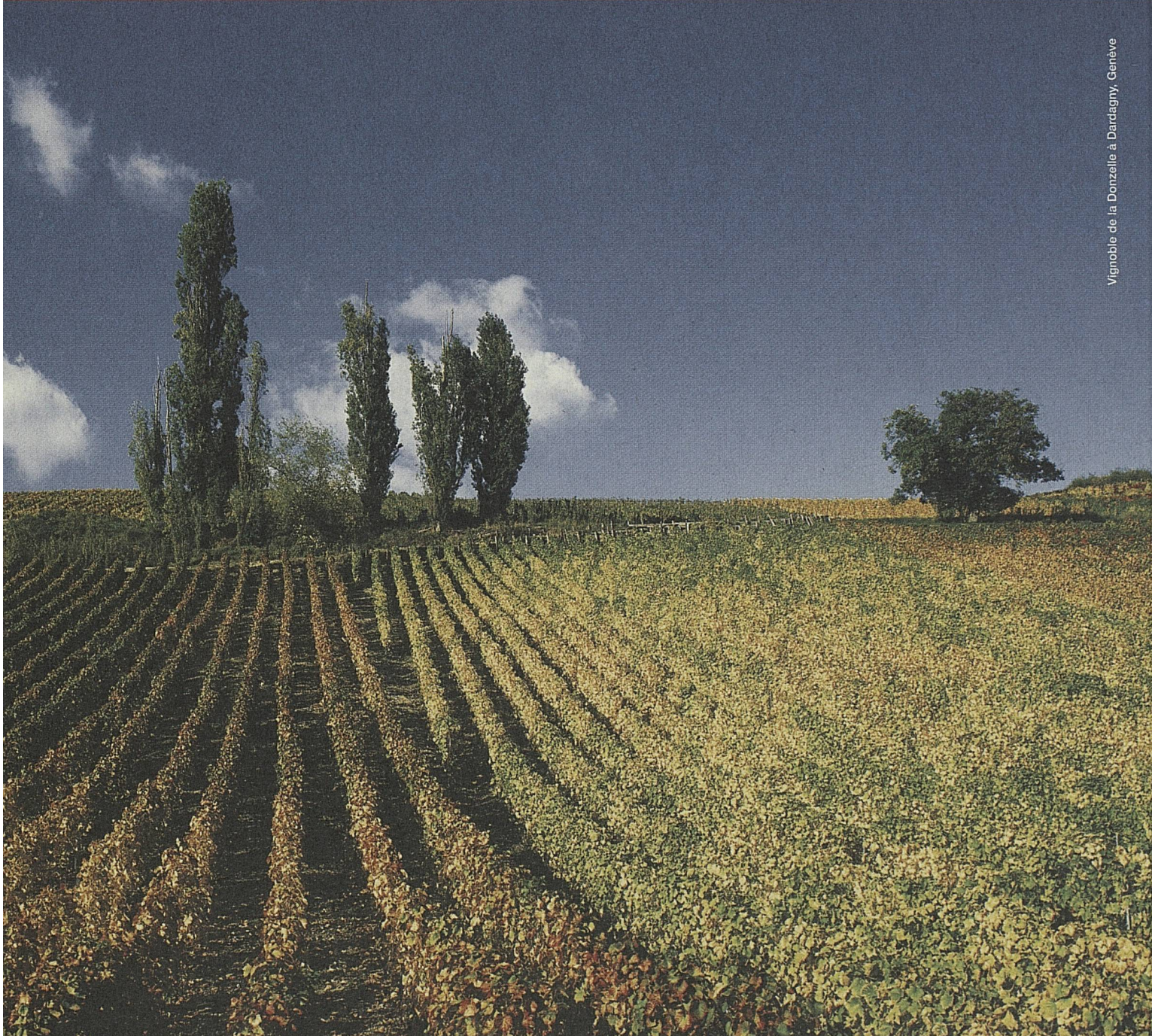
Vignoble de la Dontzelle à Dardagny, Genève