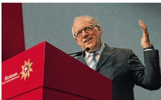
Intervenants à la 14 e Journée des Vacances à Genève.

Le 3 mai à Genève, 1231 prestataires suisses ont pu discuter des enjeux liés à l'évolution de plus en plus rapide de l'environnement touristique lors de la 14 e Journée Suisse des Vacances. Diversification de la clientèle et évolution du comportement de voyage des hôtes, utilisation de nouveaux canaux de marketing comme les médias sociaux comptaient parmi les points forts de cette journée.