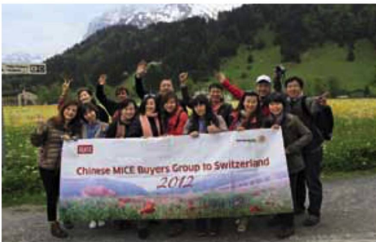
Participants chinois au voyage d'étude lors de leur excursion au Tittlis.

En 2012, le SCIB a renforcé sa présence dans les villes de Beijing, Shanghai, Hongkong et Guangzhou, notamment à travers des formations pour les agences spécialisées dans les voyages de motivation et d'autres décideurs. Le SCIB a, en outre, proposé un voyage d'étude à 12 organisateurs de voyages de motivation à Zürich, Lucerne et sur le Tittlis. Une initiative qui a immédiatement débouché sur des contrats.