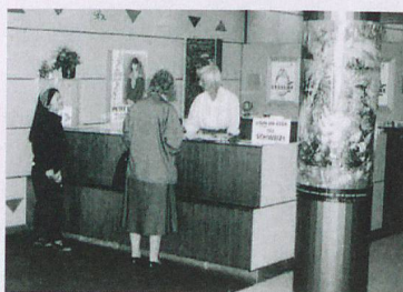
L'ONST ouvre un bureau à Stockholm pour assurer la promotion de la Suisse en Scandinavie. Suisse Tourisme est désormais revenu en Suède, après une interruption de quelques années.