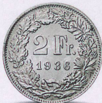
Le Conseil fédéral dévalue le franc pour faire face à la crise économique.