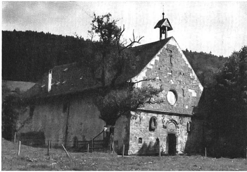
Schöntal von Nordwesten mit der romanischen Fassade

Scheitel des Wulstes ruhende Figur ist nicht mehr zu erkennen (Bild 4).