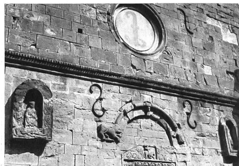
Ausschnitt aus der Westfassade der 1525 zerstörten Klosterkirche

die sich auch auf einen Teil des Waldes zwischen Langenbruck und Onoldswil erstreckte. Dieser Forst lag auf ihrem Gebiet, hatte aber zum Sprengel der Kirche St. Peter in Onoldswil (zwischen Ober- und Niederdorf) gehört. Sie verlangte nun den Zehnten vom Ertrag des auf-gebrochenen Landes, den sogenannten Neubru- chzehnten, nach altem kirchlichem Recht. So kam es schon bald nach der Gründung zu Streitigkeiten, denn die Mönche weigerten sich, die Abgabe zu entrichten, indem sie sich auf die von den Froburgern gewährte Steuerfreiheit beriefen. Darauf brachte der Pfarrer von Onoldswil den Konflikt bis vor den päpstlichen Stuhl in Rom, wurde aber abgewiesen. Bischof Ortlieb gab in seiner Urkunde die Entscheidung des Papstes bekannt. Allein der Priester belästigte weiterhin die Mönche von Schöntal, bis im Ein- vernehmen mit Graf Ludwig von Froburg, dem Vogt der Kirche Onoldswil, ein Vergleich zu-