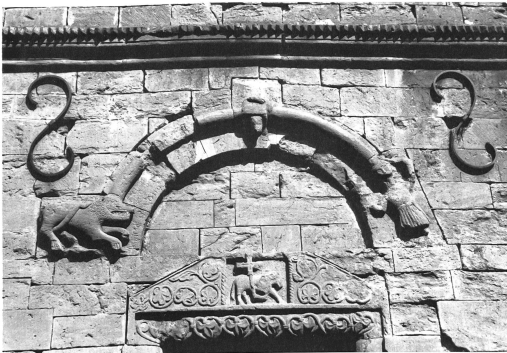
Figureschmuck über dem Portal: Lamm Gottes mit Kreuz, Rittergestalt und Löwe

umschrieben. Zahlreiche Hofstätten mit zugehörigem Ackerland werden aufgeführt, Nutz-