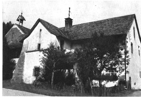
Meyerhaus mit dem Rest des durch Strebepfeiler gestützten Turmes

einem Enkel des Stifters. Er räumte mit allem auf, was nicht der Regel des heiligen Benedikt entsprach, hielt die Mönche zu strenger Zucht an und forderte Disziplin in der monastischen Tagesordnung. Ferner wandte er sich an das Kapitel in Basel und erreichte, dass der Bischof die alten Schenkungen, insbesondere auch die Verfügung Ortliebs über die Zehntenfreiheit bestätigte. Graf Hermann selbst bedachte das Kloster mit Vergabungen und Stiftungen, worauf auch etliche der froburgischen Ministerialen seinem Beispiel folgten.