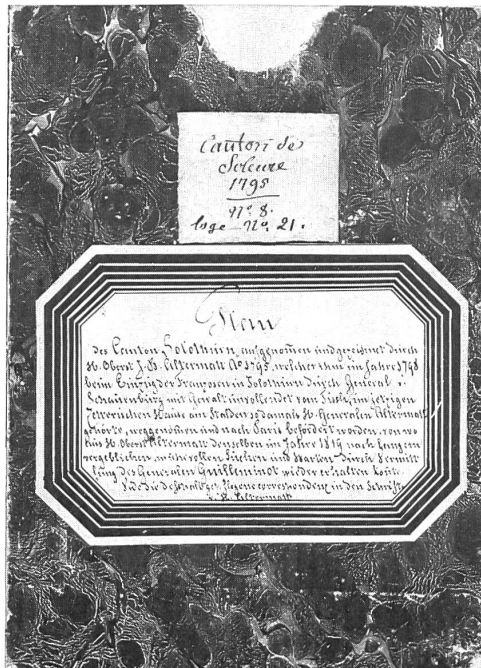
Die Karte ist heute auf Leinwand aufgezo- gen und steckt im abgebildeten Schub- er mit den Erläuterungen auf der Vorderseite.

Das Altbürgergeschlecht der Altermatt hat viele hohe Offiziere in der französischen Armee zu