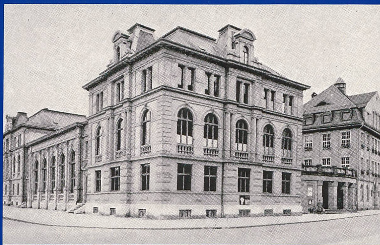
Die Gebäulichkeiten in Olten um 1930

D as wesentlich gesteigerte Geschäftsvolumen und die Erwartungen an die Zukunft machten weitere Rationalisierungsmassnahmen notwendig. Als eine der ersten Regionalbanken der Schweiz entschloss sich die EKO bereits 1969, eine eigene Datenverarbeitungsanlage anzuschaffen. Mit diesem Rationalisierungsschritt wurde eine Tradition fortgeführt, die bereits 1931 begonnen hatte, als die EKO als erste Bank der Schweiz anfang, die Sparheftbuchhaltung maschinell zu verarbeiten.