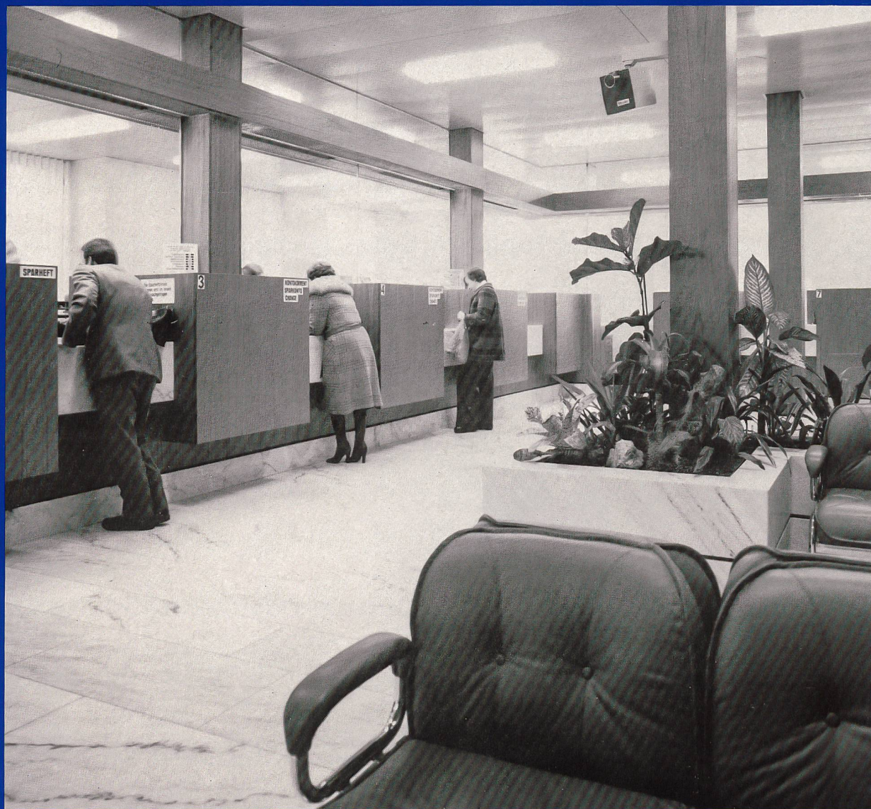
Die neue Schalterhalle am Hauptsitz

V ergleichen wir die heutigen Zahlen der Bilanzsumme mit den bescheidenen Zahlen der Gründerjahre, dürfen wir stolz sein auf das, was in den letzten 150 Jahren geschaffen wurde. Diese Zahlen erfüllen aber auch mit Zuversicht für die Zukunft. Dies umsomehr als wir wissen, diese mit