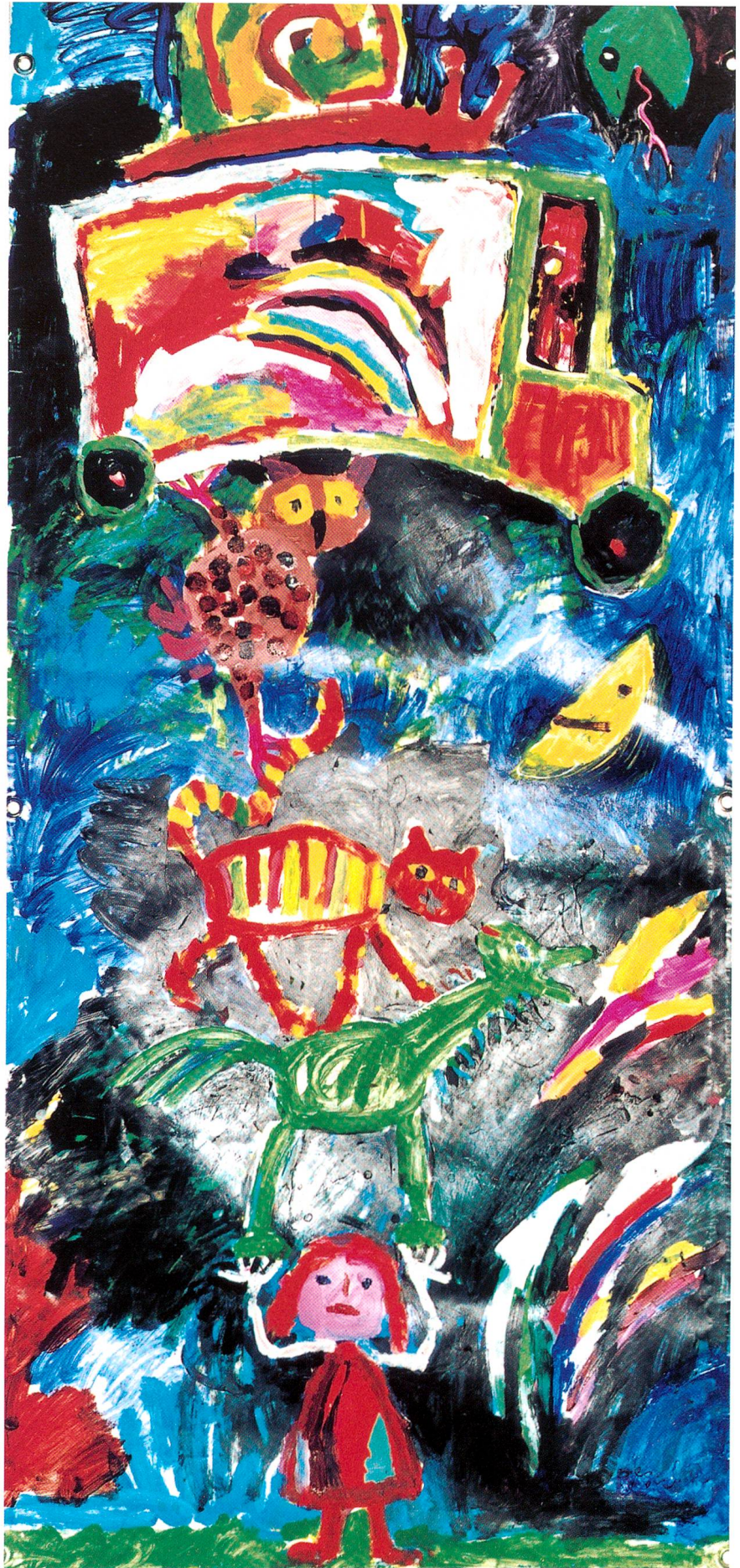
«Ballastsäule», Acryl auf Blache, 2000, 300 x 100 cm

Im kommenden Frühling wird in Zürich hinter dem Landesmuseum im Freien eine interessante Kunstausstellung inszeniert. Elf Schweizer Maler, darunter auch Regula Syz, beteiligen sich an dieser Schau. Verlangt wurden grossformatige Bilder, drei auf vier Meter, gemalt auf eine Blache mit wetterbeständiger Farbe, sodass sie im Freien stehen können. Die Malerin hat mit ihrer Arbeit begonnen, eine neue anders angeordnete Arche Noah ist entstanden, auf einer zweiten Blache in dieser Grösse hat sie den «Garten Eden» gemalt. Herrlich intensiv sind diese Bilder, wenn man sie in solcher Grösse erleben darf. Wie schafft es diese zierliche Person mit ihrem sympathischen Lächeln und ihrer anziehenden Ausstrahlung nur, dass sie mit so viel Intensität solch grosse Bildräume bewältigen kann? Dies fragt man sich als Betrachter unweigerlich. Regula Syz ist aus ihrer Persönlichkeit heraus vielen ein Rätsel, ihre Tiefen sind oft nur zu erahnen und die Welt ihrer Träume und Bilder sieht man nur bruchstückweise auf dem Papier. Reich und vielschichtig sind ihre Befindlichkeiten, stark und kraftvoll ihre gemalten Bilder, und sucht man eine Antwort auf das Erkennen ihrer Person, so gäbe es so vieles, was man sagen könnte und so wenig, was wahrscheinlich zutreffen würde, denn sie ist jeder Aussage aufgrund ihrer Fantasie immer ein Stück voraus und das betrachtende und beobachtende Auge hinkt ihrer Tatenlust hintennach.