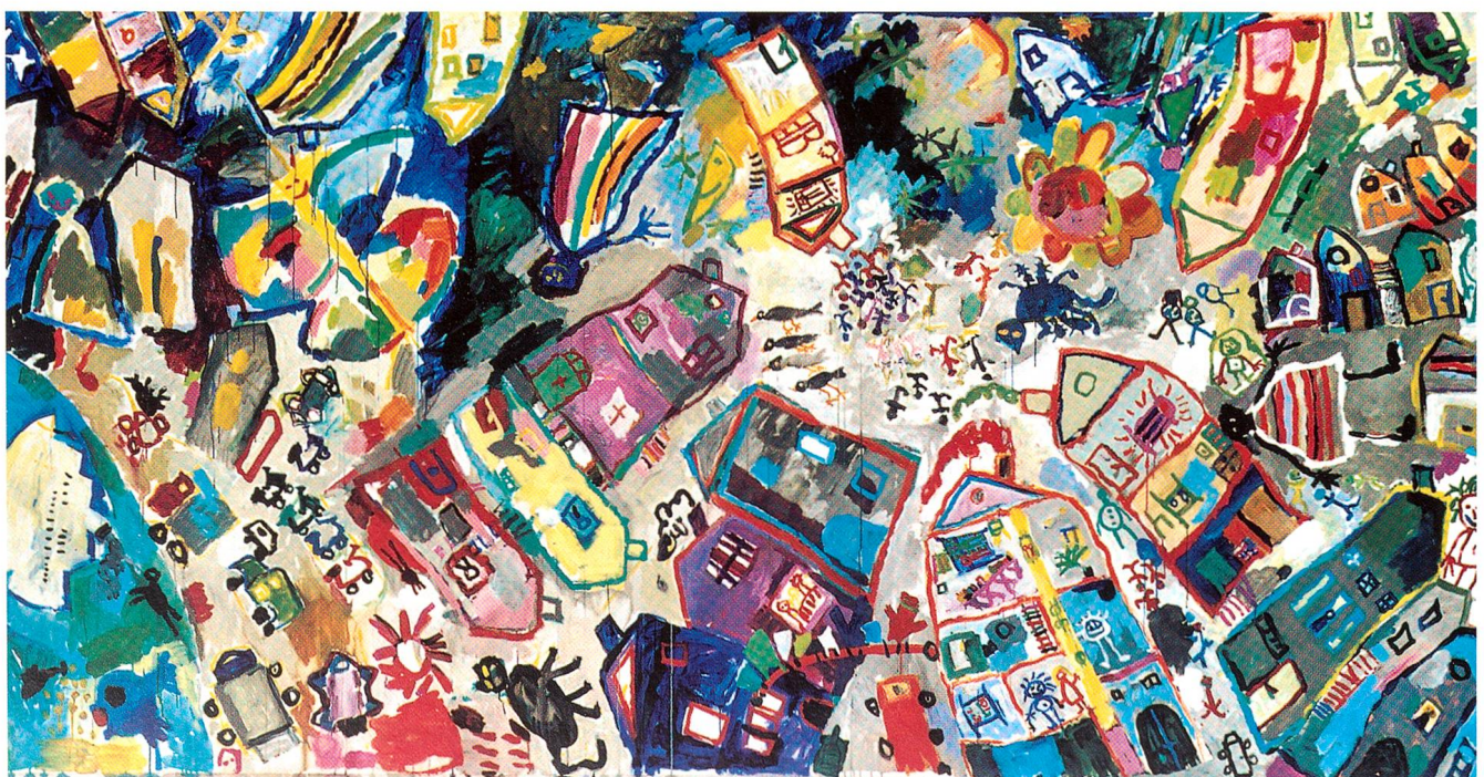
«Genua; eine Stadt am Meer kann nicht verborgen sein», Acryl auf Leinwand, 2000, 200 x 400 cm

sondern das Bewusstsein eines Erwachsenen, einer Malerin, eines Menschen mit einer Lebens- und Malgeschichte und einer persönlich geprägten Philosophie über das Leben und das Sterben. Mit dem Erkennen der eigenen Vergänglichkeit setzt Regula Syz da ganz andere Akzente und Inhalte. Wohl ist alles verfremdet, Genua wie auf einem Skizzenplan entfächert, die Häusergruppierungen gehen in alle Richtungen, ungefähr im Zentrum des Bildes ist der Hauptplatz auszumachen, auf den alle Strassen hin führen. Der Hafen ist zu erkennen, das Aquarium, eines der grössten in Europa, Strassenzüge, Autos und Motorräder, Menschen, Hunde und Katzen; auf einem Platz versammelt, in kindlich anmutender Anordnung ein Reihe Vögel, Raben, Papageien fast gleich gross wie die schwarze, plattgedrückte Katze, denn die Proportionen und die räumlichen Auflösungen sind verschoben, die Perspektiven verändert, skurrile Anordnungen erschliessen einem nie geahnte Tiefen. Man darf in die Häuser hineinsehen, die Fensterfronten sind weggeputzt, die Räume sind flächig, haben kaum Tiefe und sind offen. Das Auge wandert von Stockwerk zu Stockwerk, das Atelier der Malerin ist zu erkennen, Bett, Maltisch, Malrequisiten, Papierrollen und Bemaltes liegen auf dem