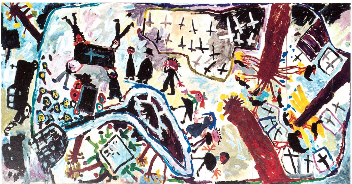
«Beerdigung», Acryl auf Papier, 2000, 150x300 cm

«Mir händ dänn au no en böse Hund» – dieses Bild, einen Meter fünfzig auf