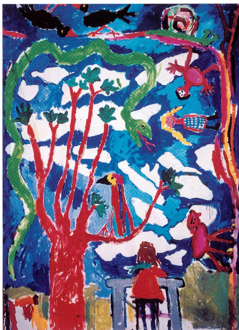
«Introversion», Acryl auf Leinwand, 2000, 200x150 cm