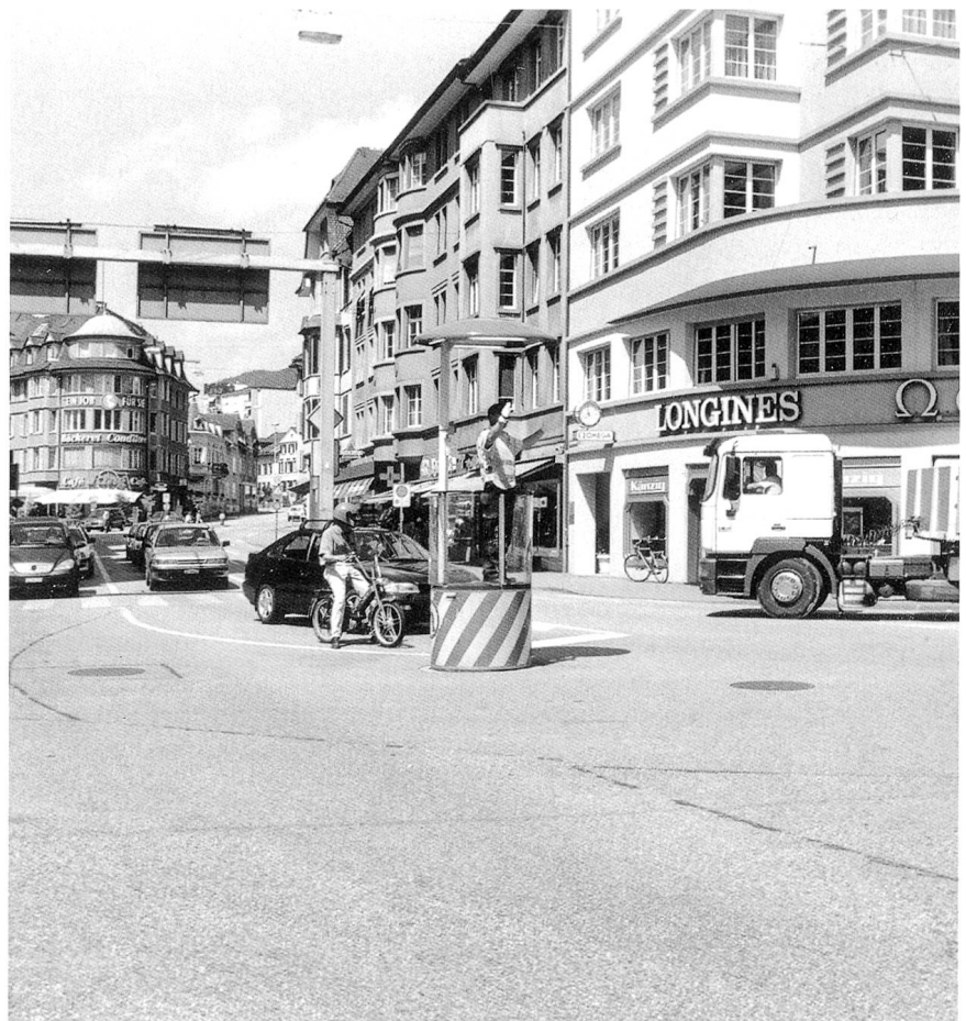
Abbildungen Seite 78, 79, 80: Die Stadtpolizei bei ihren vielfältigen Tätigkeiten im Dienste der Allgemeinheit und ihr breit gefächertes Fahrzeugpark