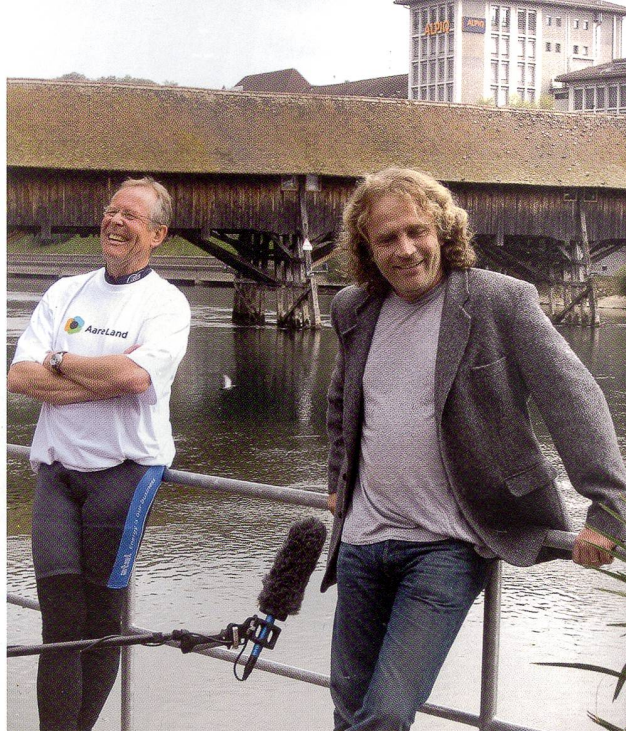
Stadtpräsident Ernst Zingg und Schriftsteller Alex Capus begrüßen den Tross bei der Eröffnungsfahrt sichtlich gut gelaunt vor der Oltner Holzbrücke im Hintergrund.

Der AareLandWeg zeigt auch ein Stück Industriegeschichte auf. Besonders eindrücklich lässt sich dies bei Schönenwerd im Bally-Areal erleben. Zu Zeiten der Bally-Dynastie war Schönenwerd eines der blühendsten Industriedörfer der Schweiz. Fabrikbauten, Arbeitersiedlungen, Fabrikantenvillen, stattliche Schulhäuser und der romantische Bally-Park zeugen davon. Während der Blütezeit der Schuhfabriken von der Mitte des 19. bis zur Mitte des 20. Jahrhunderts verzehnfachte sich die Einwohnerzahl der Gemeinde. Die Industrialisierung veränderte das