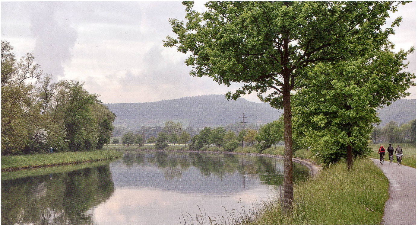
Idylle am Aarekanal im Niederamt

Mit einer gemeinsamen Velotour von Zofingen nach Aarau eröffneten im September rund 25 Behördenmitglieder den neugeschaffenen AareLandWeg. Er verbindet über eine Strecke von rund 30 Kilometern im wahrsten Sinne des Wortes erfahrbar die drei Städte Aarau, Olten und Zofingen. Der auch zu Fuss zu geniessende AareLandWeg ist ein Projekt, welches im Rahmen der Zusammenarbeit der drei Städte und Regionen Aarau, Olten und Zofingen sowie der Kantone Aargau und Solothurn entstanden ist. Entlang der Route werden Informationen zu Sehenswürdigkeiten und Besonderheiten vermittelt.