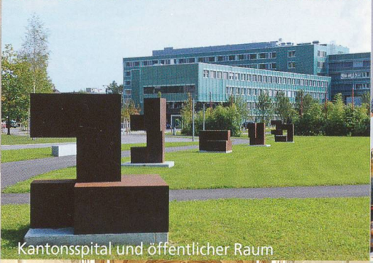
Kantonsspital und öffentlicher Raum