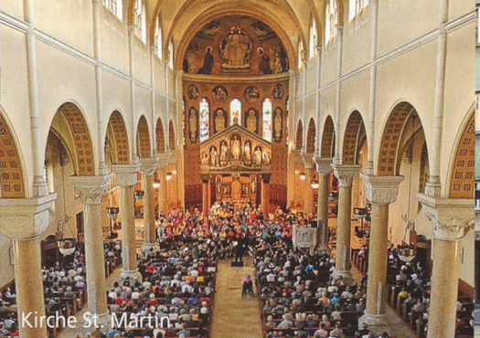
Kirche St. Martin