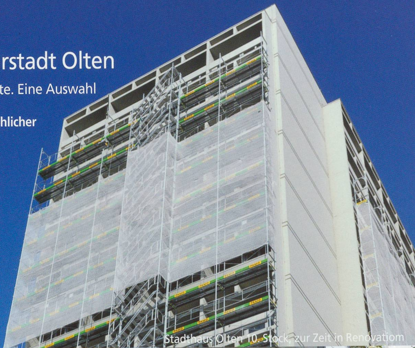
Stadthaus Olten 10. Stock, zur Zeit in Renovierung