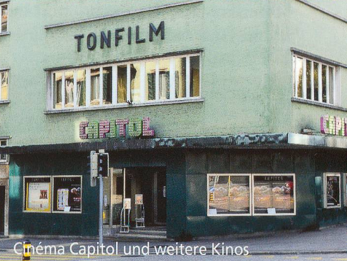
Cinéma Capitol und weitere Kinos