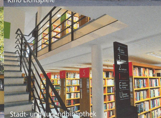
Stadt- und Jugendbibliothek