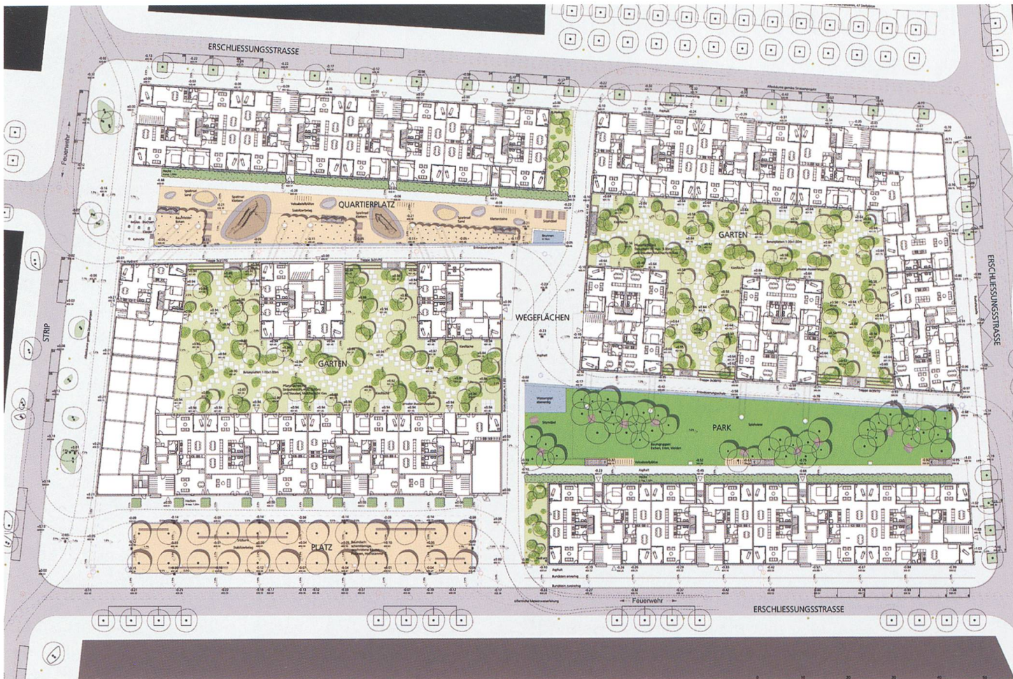
Bebauungsplan des Bereichs B4

37 Besucherparkplätze) in insgesamt acht Gebäuden: «Der Blockrand ist mit zwei Zeilen- und zwei Winkelbauten weitgehend geschlossen. In dem so entstandenen grossräumigen Hof ist eine Reihe von vier Punkthäusern eingestellt, die den Hofraum strukturieren. Die geschlossenen Blockecken antworten damit auf die Platz- und Parkstruktur des Gestaltungsplans. Die überzeugende Anordnung führt zu einer willkommenen Durchlässigkeit der Siedlung, ermöglicht wertvolle Durchblicke und schafft trotz hoher Dichte viel Licht im Innenbereich.» 12 Die Gebäudehöhe bis Dachkante nimmt Bezug auf die Geländehöhe des angrenzenden Gebiets im Gheid. Die von einer Bebauung frei gehaltenen Flächen innerhalb der Baubereiche können den angrenzenden Gebäuden als Ausanlagen dienen oder als öffentlich zugängliche Flächen. Der Charakter des Stadtquartiers Olten SüdWest soll wesentlich vom Zusammenspiel der überbaubaren und frei bleibenden Flächen geprägt sein. Die Bauherrschaft hat die Absicht, sukzessive ein Quartier entstehen zu lassen, welches Raum für Gewerbe und Wohnungen sowie, je nach Bedürfnis der Stadt Olten, auch für Einrichtungen für die Öffentlichkeit (Schulen, Kindergarten, Kinderhorte, Spielplätze) gewährleistet... Dass zu einer Überbauung dieser Gesamtgrössenordnung eine sorgfältige und differenzierte Entwicklung gehört, ist für die Bauherrschaft eine Selbstverständlichkeit. Die Bauherrschaft freut sich, mit dieser Phase einen ersten Schritt in der Wohn-