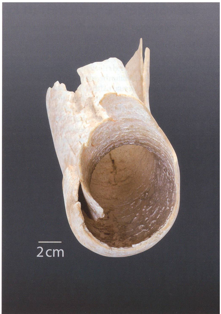
Das Stosszahnfragment des Wollhaarmammuts misst 65 cm in der Länge, 10 cm im Durchmesser und wiegt 1,1 kg. Effektiv war der Zahn dicker, weil die Ränder des hohlen und längs gespaltenen Fundstücks übereinander liegen.

Region, zum Beispiel vom Riesenhirsch ( Megaloceros giganteus ), vom Wollnashorn ( Coelodonta antiquitatis ), vom Steppenwisent ( Bison priscus ) und vom Wollhaarmammut ( Mammuthus primigenius ), die alle ausgestorben sind, oder vom Ren ( Rangifer tarandus ) und vom Moschusochsen ( Ovibos moschatus ), die heute nur noch im hohen Norden vorkommen. Die drei letzten Nachweise von Wollhaarmammuts stammen aus der Kiesgrube Gunzgen (Jahr 2003, Stosszahnfragment, NMO Nr. 26576/ETH-28441: 21000 \pm 120 BP, kalibriertes Alter 23700 bis 23050 v. Chr.), aus der Kiesgrube Hard in Däniken (Jahr 2008, Stosszahnfragment, NMO Nr. 26629/ETH-37528: 12920 \pm 50 BP, kalibriertes Alter 13600 bis 13050 v. Chr.) und wieder aus der Kiesgrube Gunzgen mit dem aktuellen Fund, der erstaunlicherweise viel älter ist als die beiden anderen. Der Stosszahn ist nur wenig jünger als die berühmten eiszeitlichen Funde von Niederweningen im Kanton Zürich und stammt aus einer nicht allzu kalten Zeit vor dem sogenannten Letzten Glazialen Maximum. Die Eiszeitkarte (Bild) zeigt die Häufung der Mammutnachweise in der Region Olten.