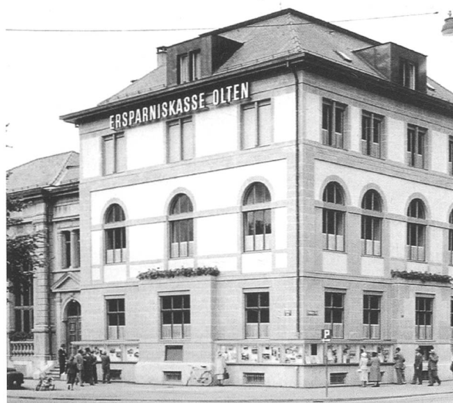
Das Gebäude der ehemalige Ersparniskasse Olten 1920 (oben) und 1960 (unten)

Bekannt ist aus der Fotosammlung Rubin und der Ausstellung der Oltner Stadtbilder 2009 des Historischen Museums das Beispiel des linksseitigen Aareprospekts und hierin der Konzert- und Verwaltungsbau der vormaligen Ersparniskasse Olten nach Plänen des Malers und Architekten Gottfried Julius Kunkler, einem Schüler von Gottfried Semper (Semperoper Dresden, ETH Zürich). Der Vergleich der Zustände von 1920 und 1960 zeigt eine beispiellose und unentschuld bare Zerstörung eines historischen, stimmigen Ensembles. Rechtfertigend kann hier immerhin von einer bewussten, zeittypischen Gesamtintervention im Sinne einer stilistischen Adaption ausgegangen werden; trotzdem eine, zumindest aus der zeitlichen Distanz, nicht anders als missraten und dekadent zu bezeichnende Gesamtmaßnahme.