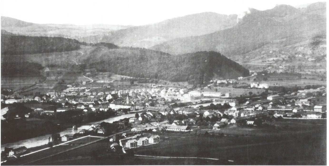
Aufnahme nach 1889. Weite Teile des Bannwaldes waren zu dieser Zeit noch Pflanz- und Weidegebiete.

ten und Aarburg (Mühleloch), auf der Froburg (Übergang über das Erlimoos), bei Egerkingen (Ramelen), bei Lostorf (Gross-Chastel) waren die Gegend und die Juraübergänge strategisch gesichert. Ob all diese Mardellen (Wohngruben) gleichzeitig bewohnt waren, gilt nicht als gesichert. Dafür sind die Grabungen und Untersuchungen bisher nicht ausreichend geführt worden.