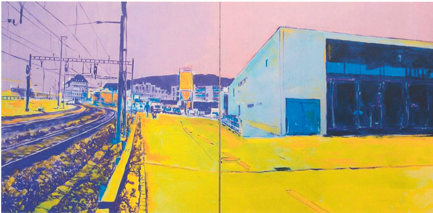
An der Bahnlinie Solothurn–Olten, Feuerwehrmagazin 150x300cm 2013

Ein Licht, das Zeichen setzt und sich doch unterordnet. Roland Weibel malt grosse Bilder, und er ist sich bewusst, dass die von wenigen erworben werden können. Aber was will dies schon heissen, ihn reizt die grosse Fläche, der weite Raum, ein Gefühl von Unendlichkeit und Freiheit nimmt von ihm Besitz. Er weiss um die Dinge, die man ständig loslassen muss, es ist dies manchmal ein schmerzlicher Prozess, aber es liegt auch ein Stück Freiheit darin, die ihn beflügelt. Die Intensität der Farben ist voller Kraft und spielt mit Bewegungen, dies immer im Kontrast von hell zu dunkel, geheimnisvoll, weil man das Gefühl hat, in eine Traumlandschaft einzutauchen, weil sich die Strassen und Häuserfronten verändern, der Flusslauf zu einem Abenteuer wird und durch die expressive Malweise alles unglaublich viel Faszination bekommt.