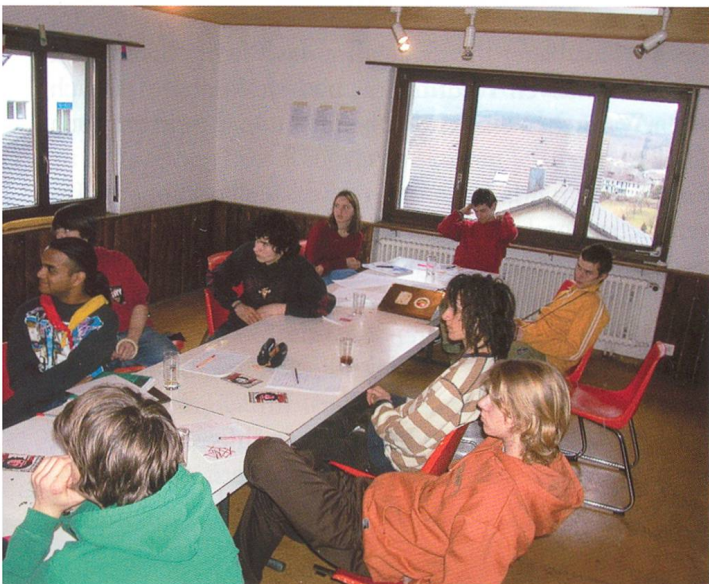
Das grösste Zimmer des Hauses diente als Mehrzweckraum.

die moderne Einbauküche und das Führerzimmer. Über die Treppe gelangt man ins erste Dachgeschoss, wo sich ein Raum für die Pfadfinder und der Cheminéeerraum für die Rover befindet. Dies ist wohl der schönste Raum des Hauses mit Blick über die Stadt Olten bis in den Jura. Im zweiten Dachgeschoss bieten 40 Schaumstoffmatratzen in zwei Räumen Gelegenheit zum Schlafen.