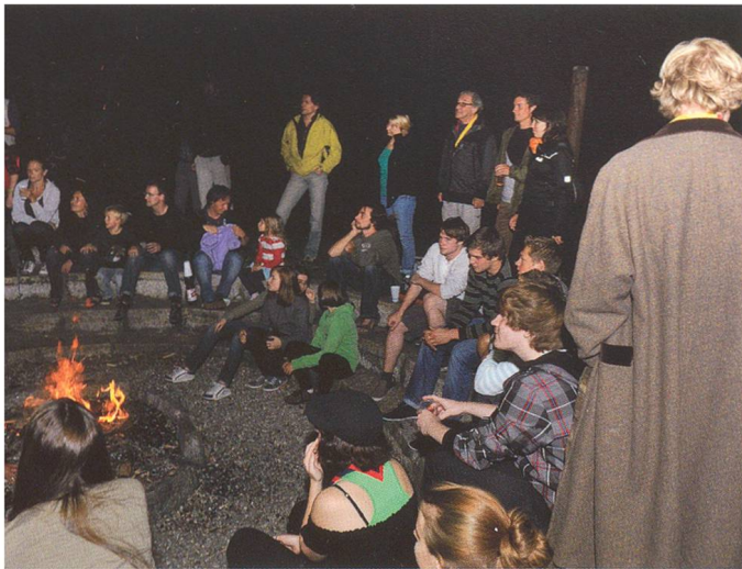
Östlich des Heimes bauten die Pfadfinder eine kleine Arena.

minifassung renovieren, neue Duschkabinen und sanitäre Einrichtungen installieren, alle Zimmertüren kontrollieren und reparieren, Aussenwände isolieren und neu streichen und auch einiges an Mobiliar ersetzen (Tische, Stühle). Diese Arbeiten wurden auf mehrere Jahre verteilt. Das bedeutete aber trotzdem, Mitglieder des Heimvereins, Altpfadfinder, Ehemalige, Eltern der Aktiven, Gönner und Firmen um eine Spende an die Heimrenovation zu bitten. An diese Renovationskosten leisteten auch die Stadt Olten, die Römisch-katholische Kirchgemeinde und die Evangelisch-reformierte Kirchgemeinde Olten grössere Beiträge.