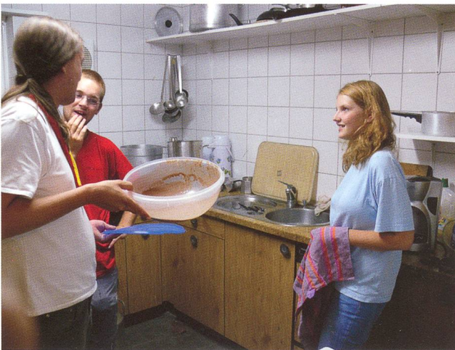
Arbeiten in der Küche

Glückwunschkarten-Verkauf vor Weihnachten war damals noch attraktiv. Er brachte in den folgenden zehn Jahren immer wieder erfreuliche Beträge in die Kasse des Heimvereins. In all den Jahren versuchten wir auch, neue Mitglieder für den Heimverein zu werben. 1969 zählte der Heimverein 43 Mitglieder, 1977 waren es 88 und 1991 bereits 94. In den ersten Jahren betrug der Jahresbeitrag Fr. 10.–, einige Jahre später Fr. 12.– und wurde bis heute nie erhöht. Auch nach der Einweihung des Pfadiheimes durften wir gelegentlich grössere Spenden für das Heim entgegennehmen. So überliess uns der Katholische Arbeiterverein Olten einmal den Ertrag ihres traditionellen Lotto-Matches (Fr. 2000.–). In einem andern Jahr erhielten wir von der Pfarrei St. Marien Fr. 20000.–, den Reingewinn der «Spiralkilbi».