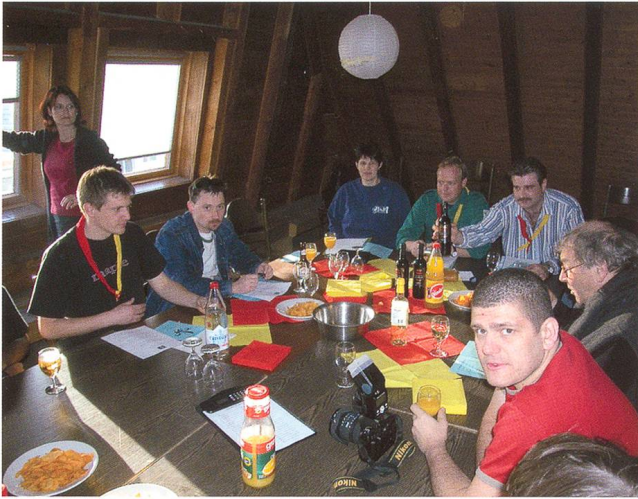
Arbeitssitzung im Cheminéeraum