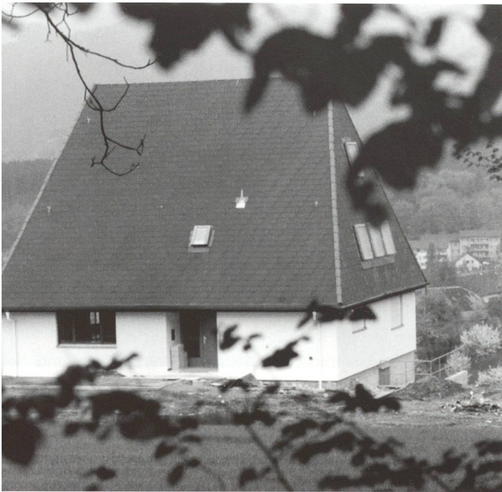
1969 Einweihung des Pfadiheimes