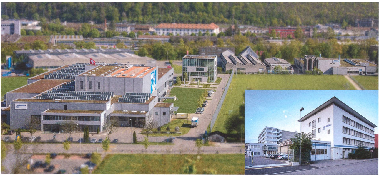
Produktionsstandort Trimbach und Hauptsitz Olten heute