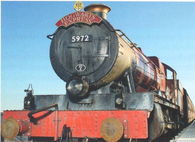
Hogwarts Express, Universal Studios Orlando, USA

nen Anforderungen gerecht und haben am Markt den unerreichten Standard für Kabinen im Bereich Einseilumlaufbahnen gesetzt. Parallel zum 75-Jahr Firmenjubiläum darf CWA im 2014 auch da 30-Jahr Jubiläum der Erfolgskabine OMEGA feiern.