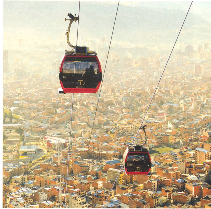
La Paz, Bolivien