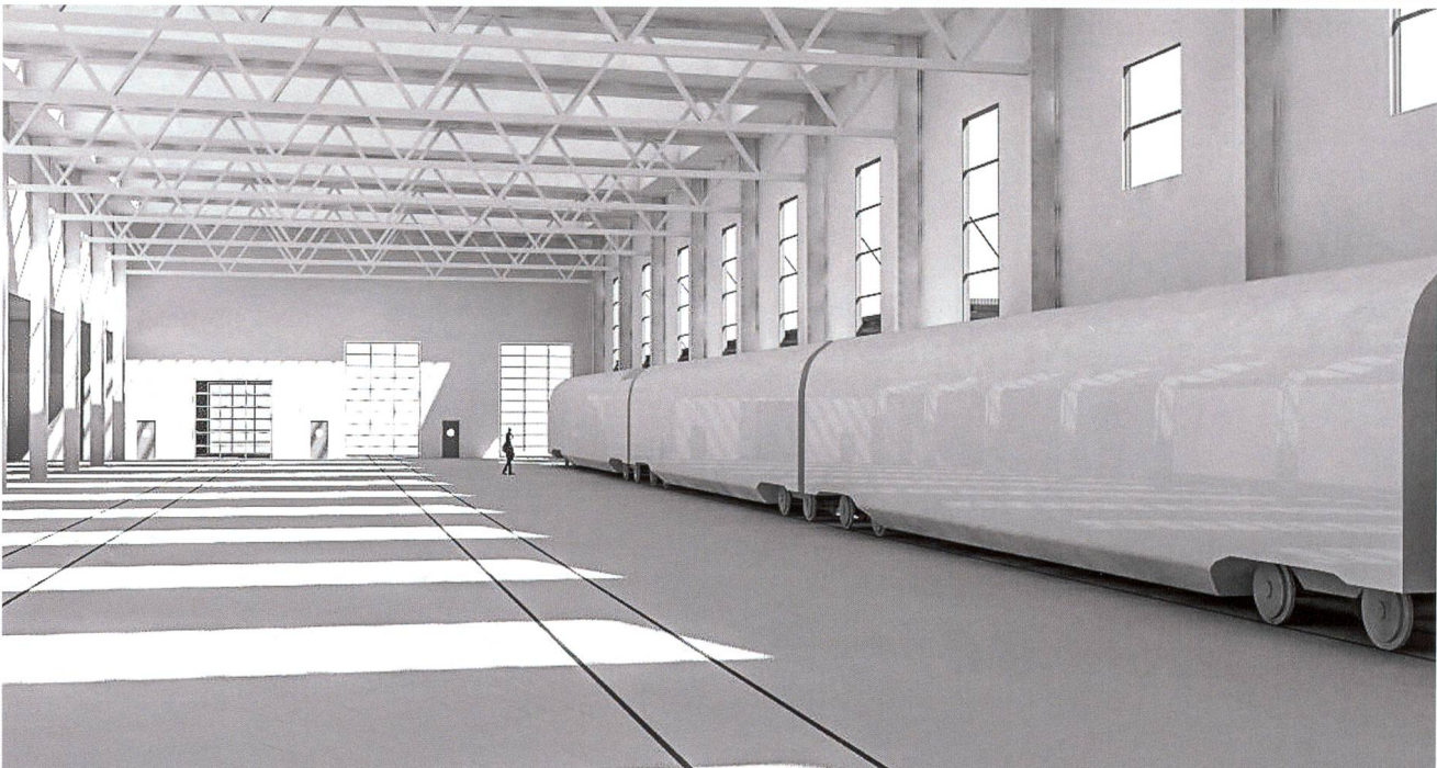
Im SBB-Werk Olten wird eine Halle mit Investitionen von rund 37 Mio. Franken angepasst, damit dort bis zu 150 Meter lange Trieb- und Gliederzüge gewartet werden können.

Baumann& Cie. eine Filiale. Im gleichen Monat verlegte der Schweizerische Handball-Verband seinen Sitz mit 15 Mitarbeitenden aus dem Haus des Sports in Ittigen bei Bern an die Tannwaldstrasse; gleichenorts zog auch die bisher in Bern domizilierte Stiftung Idée Suisse mit ebenfalls 15 Mitarbeitenden ein. Von Dietikon nach Olten kam der Verband Schweizerische Zentrale Fenster und Fassaden mit 18 Beschäftigten. Ein wichtiger Arbeitgeber in der Region, die Migros Verteilbetrieb Neuendorf AG, konnte zum Jahreswechsel ihr für über 67 Mio. Franken realisiertes Logistik Center Ost für Non-Food- und Fachmarkt-Artikel in Betrieb nehmen, in dem 18 Aussenlager konzentriert wurden. Leider gab es aus der Region auch Negatives zu berichten: Glas Trösch kündigte die Schliessung des Werks Trimbach an, das Prototypen und Kleinserien von Aussenverglasungen für Automarken der Luxusklasse herstellte, bis Ende Mai. 47 von 52 Mitarbeiten-